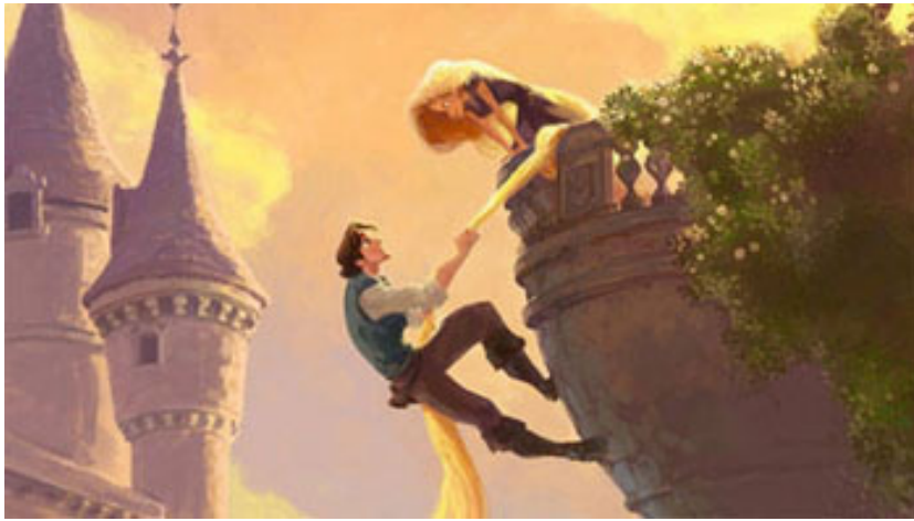
長髮萬苜公主用她的髮辮做繩索把王子拉上來