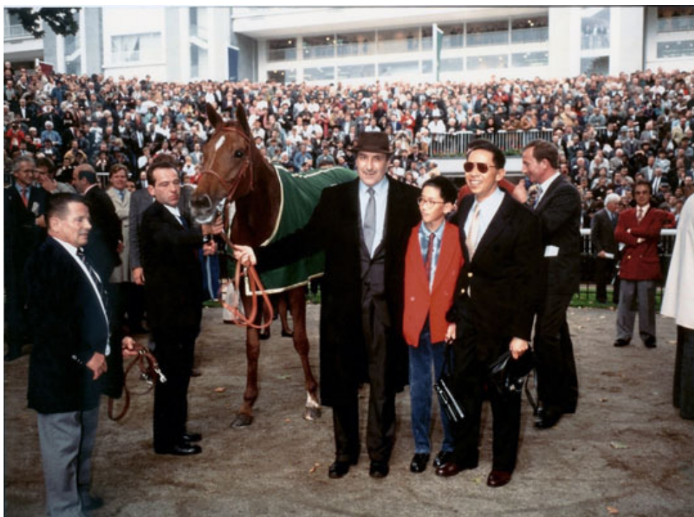
家亮對「海都市」欽佩不已

這樣的場面讓兒子深受震撼，給他的少年時光留下了深刻的印象。他走到我們的英雄「海都市」旁邊，輕吻她的鼻子。