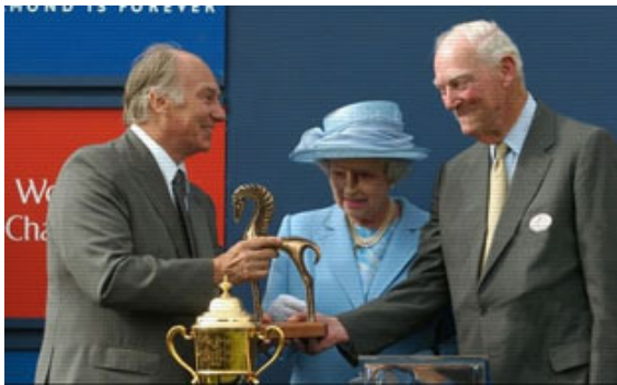
阿迦汗王子從英女皇手中接過獎盃