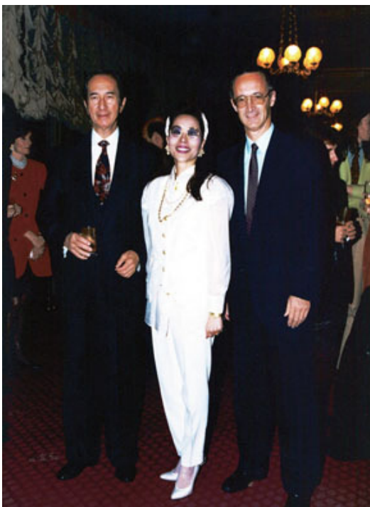
澳門賭王何鴻燊、崔黃紫靈和法國賽馬會總裁Romanet（1993年10月）

「海都市」終於完成了她的使命，實現了我寄託在她身上的所有希望和夢想，她也實現了李思博的終生願望。媒體將1993年的凱旋門大賽形容為「小人物一鳴驚人的一屆大賽」。