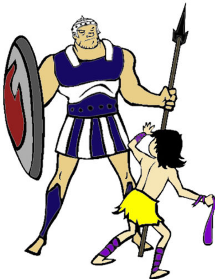
我們的形勢就如大衛迎戰巨人

即便有人在小雌馬身上押寶，博彩市場也只是看好一匹英國小雌馬「友誼用戶」（User Friendly）。我們的小雌馬從沒有贏過一級賽事，所以她的賠率（法國博彩賠率）高達1比37。