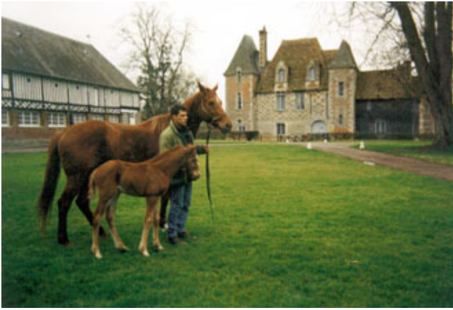
維多馬場裡只住著「海都市」與兒子「大海洋」