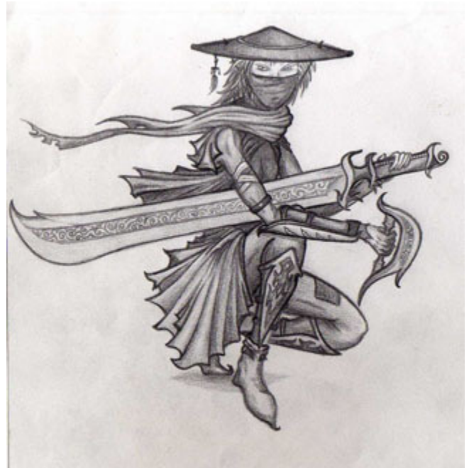
母親永遠積極進取，永不氣餒。