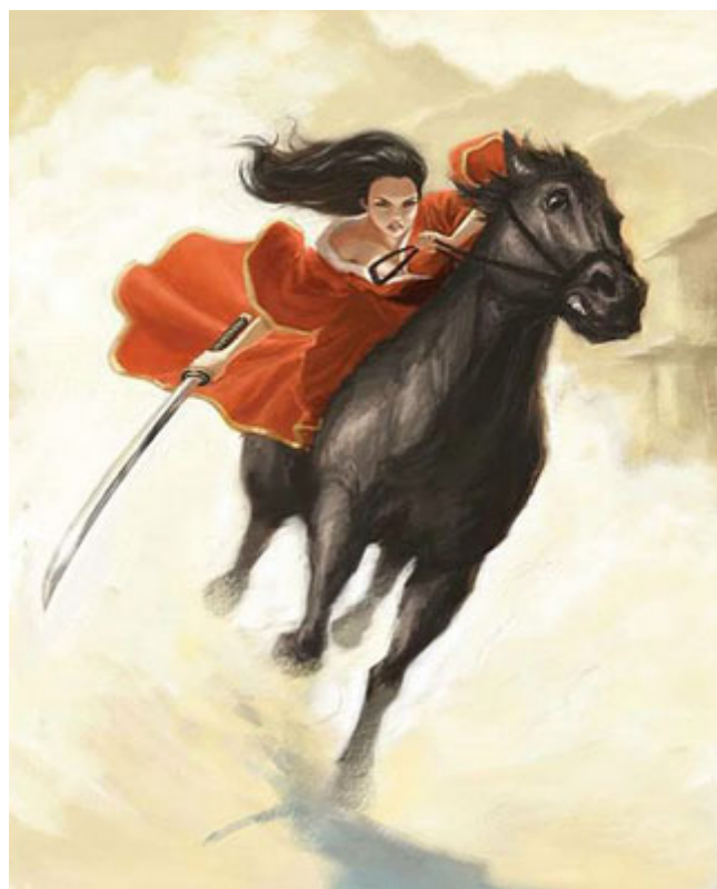
對瞭解母親的我，在我眼中她與海都市是「女俠與愛駒」

為了展開新的配種事業，母親租用了他的老師兼好友韋士登剛剛空置出來的維多種馬及育馬場。這馬場佔地六十公頃，內設母馬產房、公馬配種柵，六十個馬槽及備有員工宿舍及馬主住堡壘，設備高檔，租金昂貴，每月龐大的支出只為了培育一匹母馬，是一件不可思議的事。但母親一意孤行，於是海都市就成為了維多種馬及育馬場（Haras de Victot）的唯一住客。