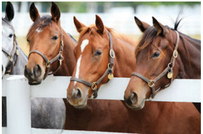
母親能忍受與愛駒的分離之痛嗎？

母親無法與自己畢生鍾愛的「海都市」分離，暗中開設公司，用高價贖回「海都市」的擁有權。