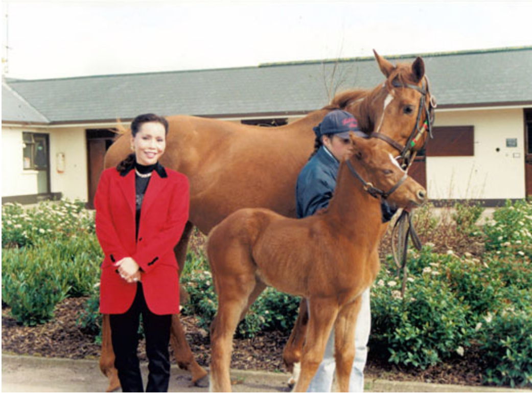
母親與1997年「海都市」與「臨泰萊」生下的小雌馬「美利加」 (Melikah)

然而，父親終於難以忍受「那個中國婦人與她的母馬」這樣的蔑稱，受不了來自育馬界的鄙視，將懷了孕的「海都市」出售了。崔氏的賽馬事業與鴻圖似乎要劃上句號了，不過事情遠未結束。