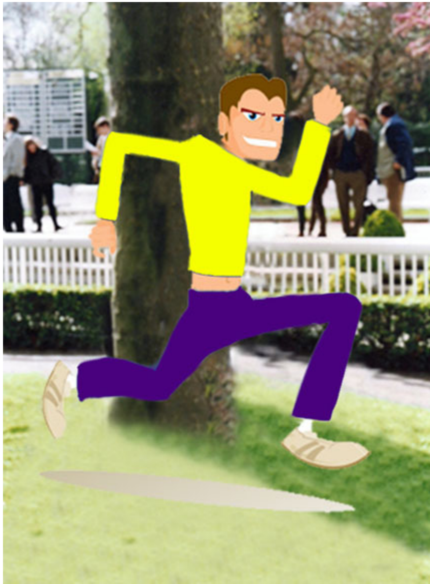
父親遠離賽馬活動

凱旋門大賽後，勝利的狂喜漸漸平淡下來，家庭生活復歸平靜。此時，父親卻突然宣佈我們要停止一切賽馬活動。