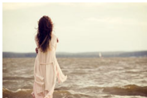
母親失落時只能向大海傾訴

母親成了育馬界的笑柄，人家嘲笑她是「那個中國婦人與她的母馬」（la Femme Chinoise avec sa Jument）。我想這些人未必是出於惡意，畢竟馬匹配種及培育馬匹是一項歐洲世代相傳、規則嚴格的事業，育馬業個中複雜，外行人不宜插手。