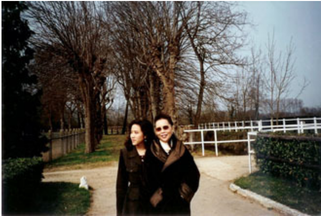
母親與嘉心在多維爾的維多種馬/育馬場 (Haras de Victot) 共度週末