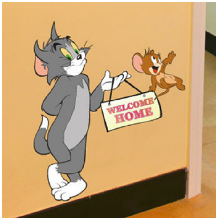
歡迎回家——卡通片《Tom & Jerry》