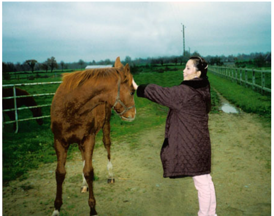
崔黃紫靈與「大海洋」

到了1996年的配種季節，母親為她珍愛的「海都市」選擇了穆罕默德酋長的愛駒「臨泰萊」，他是1995年凱旋門大賽的冠軍馬。當時母親配種專業知識並不豐富，只是遵循馬界的一個說法行動，讓最優秀的母馬配最優秀的公馬，培育出最優秀的下一代。