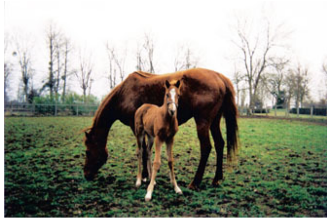
「海都市」與初生小雄馬「大海洋」在維多馬場