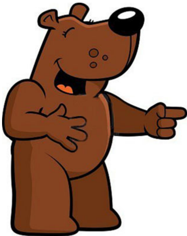
母親對「海都市」的愛，助她渡過被人嘲笑的難關

母親成了育馬界的笑柄，人家嘲笑她是「那個中國婦人與她的母馬」（la Femme Chinoise avec sa Jument）。我想這些人未必是出於惡意，畢竟馬匹配種及培育馬匹是一項歐洲世代相傳、規則嚴格的事業，育馬業個中複雜，外行人不宜插手。