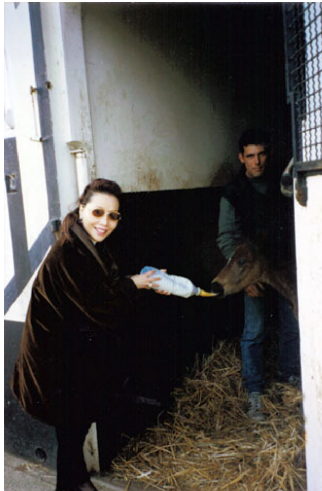
正在餵飼小馬的母親

1995年，「海都市」與法國最優秀的種馬「白令」(Bering) 配種，並於1996年2月15日誕下漂亮的小雄馬「大海洋」(Urban Ocean)。