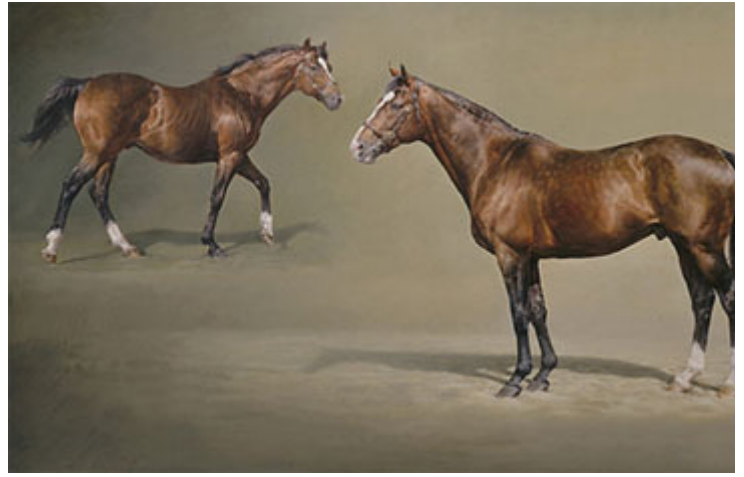
「鞍匠井」(Sadler's Wells)， 冠軍種馬，種馬之王

比手劃腳的「聰耳聾人」之旅就這樣開始了。母親的英語是在英國大學裡學習的，跟「育馬之國」愛爾蘭的英語口音完全不同。種馬場雖然國際化，但人們溝通都用愛爾蘭英語，連法語翻譯員也沒有一個，又怎麼會有中文譯員呢？母親本來就很難聽懂愛爾蘭口音，更何況裡面還夾雜著許多陌生複雜的配種專業詞彙。母親對我說，她就像身處電影《迷失東京》(Lost in Translation)。她過去在法國育馬界掙扎求存，現在又要接受愛爾蘭育馬界的挑戰！