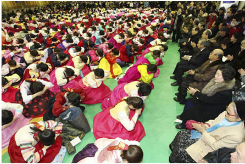
東方人都講究孝道，聽從父母之命，是不敢違背長輩的安排或決定的

我不敢過問長輩間的事，只是開始一心打網球。我週末所有時間都花在了網球場上，不過一直奇怪為什麼父母不再讓我去尚蒂伊馬房度週末。中國人都講究孝道，聽從父母之命，是不敢違背長輩的安排或決定的。