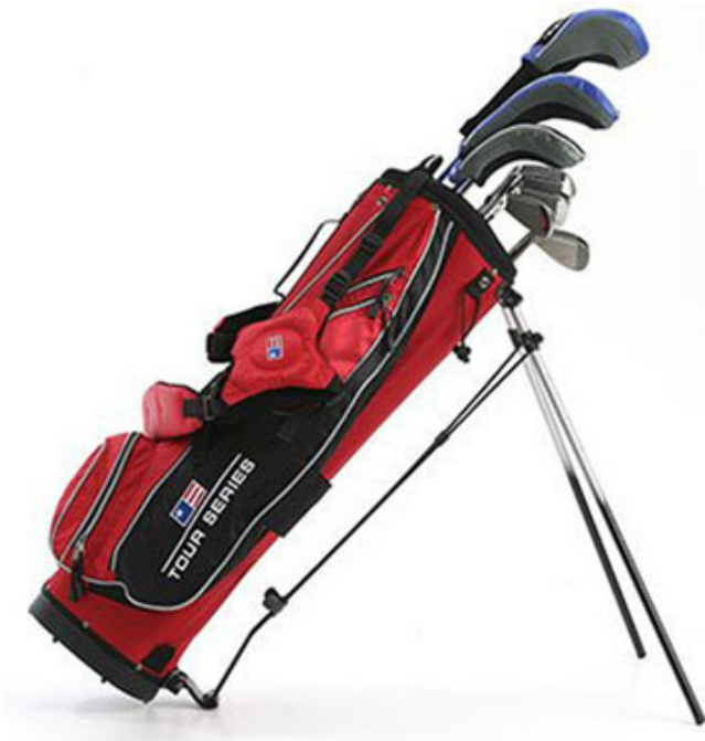
青少年高爾夫球杆超級套裝

父親聽我提到高爾夫球，像著了魔似的，立刻把我帶到運動用品專賣店，給我挑選了一套精美青少年高爾夫球杆。