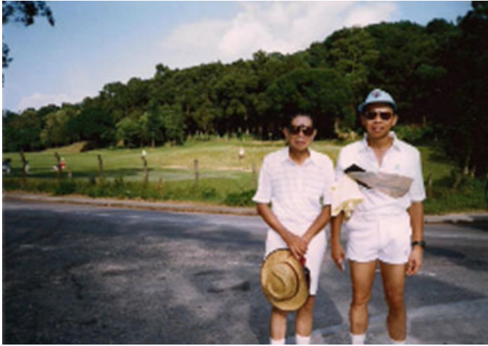
父親與祖父走遍世界各地，享受高爾夫球之樂