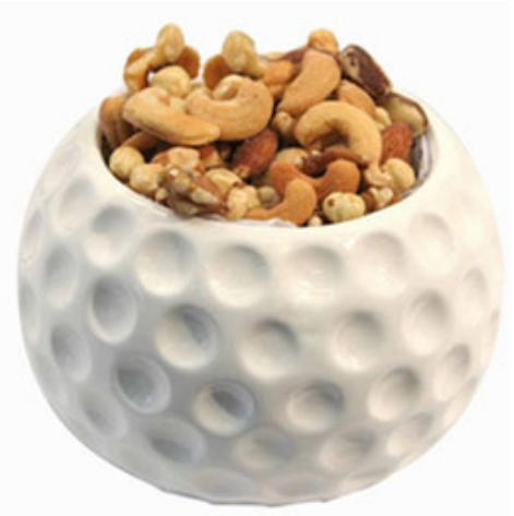
英國人叫球痴為果仁母親說是球痴夫人們的苦果仁

當年定居巴黎時，我只有四歲。然而，兩歲時，父親的高爾夫球熱情便已深深烙印在我身上。西班牙高爾夫巨星塞維·巴勒斯特羅（ Seve Ballesteros ）是父親崇拜的英雄，為了一睹他的風采，父親帶著我去香港皇家高爾夫球會跟隊觀看球賽。當時父親全部心神都在學習偶像打球上，居然完全忘記保護在烈日下曝曬的兒子。回家時，媽媽看到寶貝兒子曬得像燒紅的龍蝦，心疼不已。