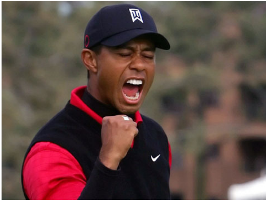
泰格•伍茲 (Tiger Woods)

自此，每個週末我都在Saint-Nom-la-Breteche高爾夫球場度過。這裡正是法國尊尚高爾夫球會舉辦法國公開賽的地方。父親是球會內唯一的中國會員，也是唯一的亞洲會員。