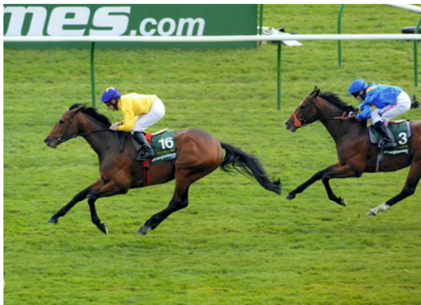
「海都之星」在二千堅尼大賽中表現超凡

靳能對「海都之星」信心十足，使得岳斯也異常淡定冷靜。岳斯深信這匹佳駟必能克服場地的不足，再次展現昔日在二千堅尼大賽中的非凡風采。