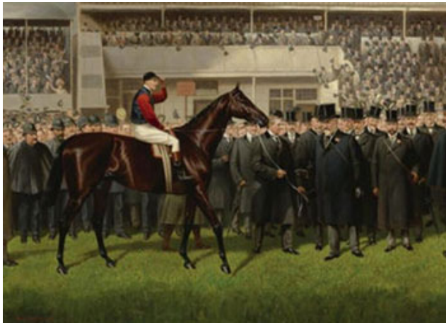
英皇愛德華七世名下的Minoru