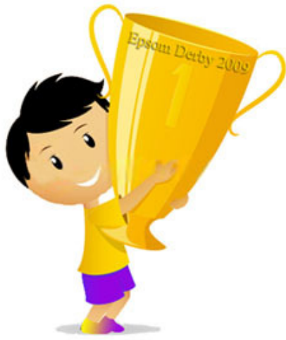
年僅二十七歲的年輕人贏得2009年的打吡大賽