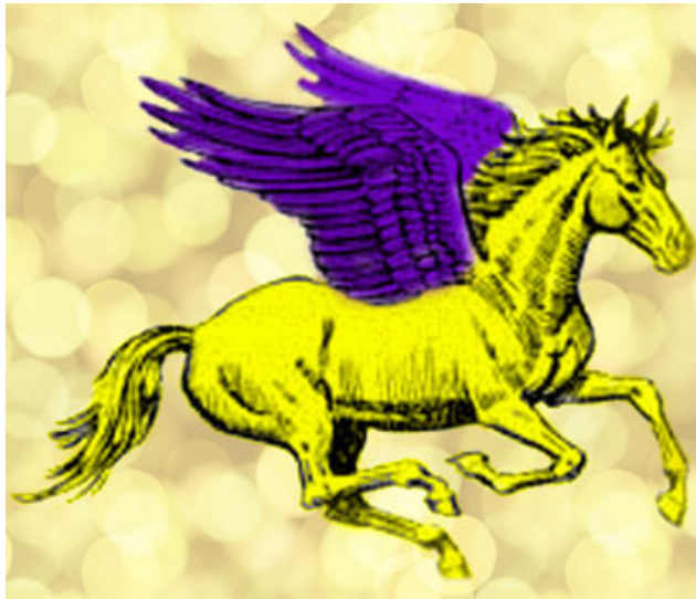
他用實力證明自己就是冠軍馬