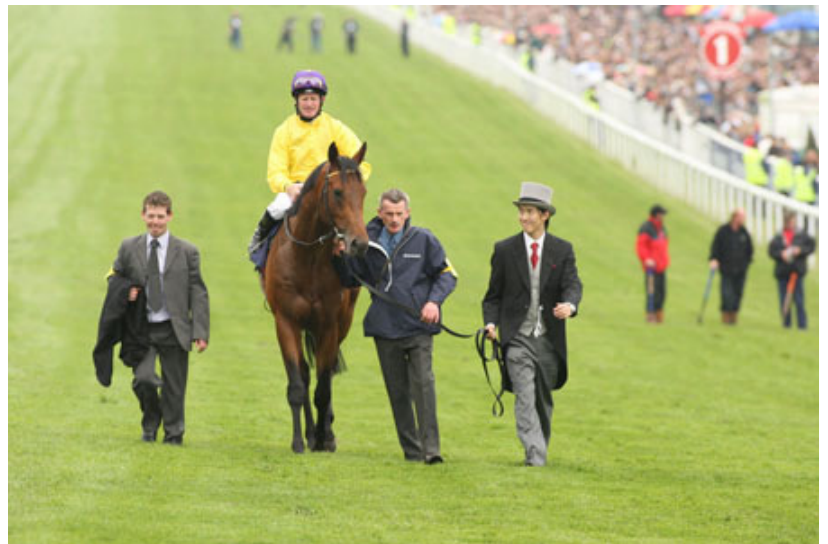
2009年打吡大賽勝出後，家亮領著愛駒「海都之星」

我努力平復情緒，鎮定接受頒獎和訪問。不知為何，記者們得到錯誤消息，誤會我是夜總會老闆。我不知道這是什麼原因，或許是因為我生性內斂，不善辭令吧。也可能是我與倫敦帝國學院和卡斯商學院的朋友們組成了音樂協會的緣故，造成記者的誤會。