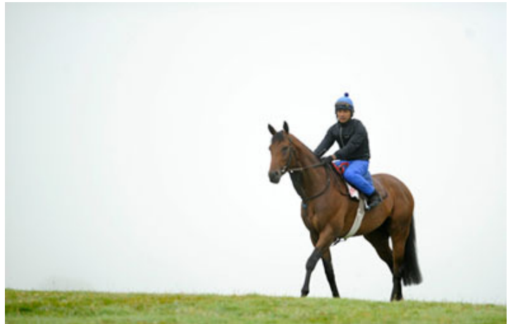
「海都市」離世而去，遺下「海都之星」為她撰寫墓誌銘

然而，馬匹在賽場一決高下只不過是數分鐘，瞬息即逝，賽馬只是一個很短暫的過程。身為博彩媒體，他們都重視預測馬匹輸贏的賽果多於關注馬匹本身的成就。當飛機漸漸接近香港時，我忽發奇想：「海都之星」的故事確實值得傳誦，但由誰來負責呢？」正想入睡之際，半夢半醒的我腦海中浮現一句古老諺語：「求人不如求己」，我知道怎做了。