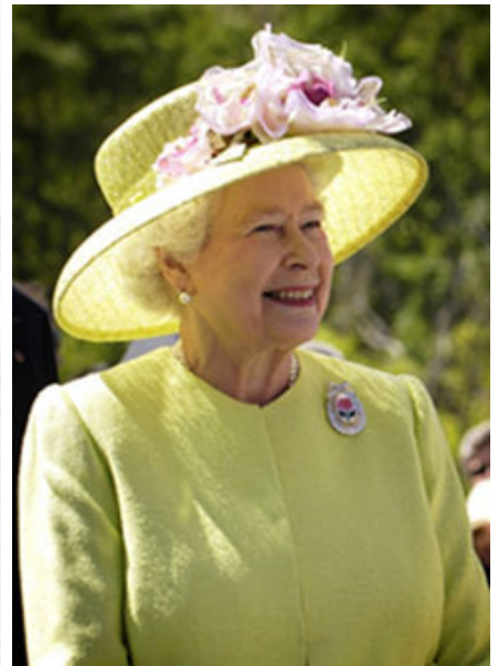
女皇溫和親切的形象，令我畢生難忘

女皇問我為何投身賽馬事業，我解釋說這一切都歸功於母親，是她在我童年時期，就把對賽馬的熱愛深深植根於我年幼的心間。見我年紀輕輕便已熱愛馬匹，又對馬匹血統瞭若指掌，英女皇十分感動。