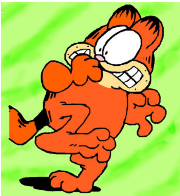
我緊張得四肢僵硬