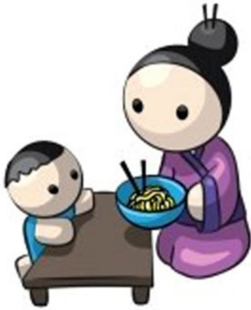
Tassa Eida與兒子「吾目之光」 Minoru