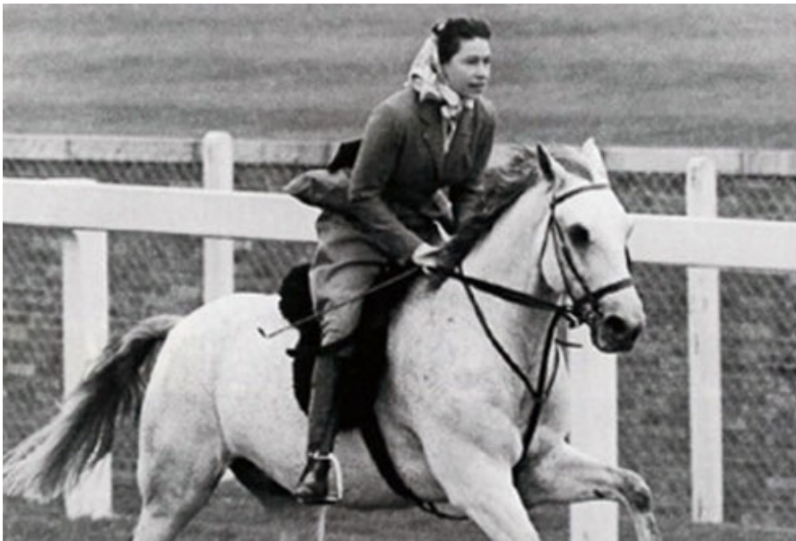
女皇擁有豐富的賽馬和育馬知識，熱衷賽馬

女皇接見了我，祝賀我成為她記憶中最年輕的打吡大賽冠軍馬主，氣氛輕鬆起來。女皇擁有豐富的賽馬和育馬知識，對「海都市」亦知之甚詳，瞭解她在馬場上和配種生涯中所創下的驕人紀錄。最遺憾的是女王旗下馬房的賽馬從未能為女皇勝出過打吡大賽及凱旋門大賽。