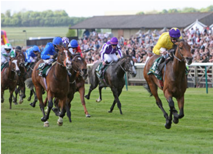
「海都之星」在2009年的二千堅尼大賽中勝出

若說二千堅尼賽事精采，那打吡大賽便創造了傳奇。我們的寶貝馬已經長大，用實力證明了自己是真正的王者。他勝出了一哩賽二千堅尼，又奪得一哩半打吡大賽的錦標，創下與二十年前「納沙溫」相同的奇跡。