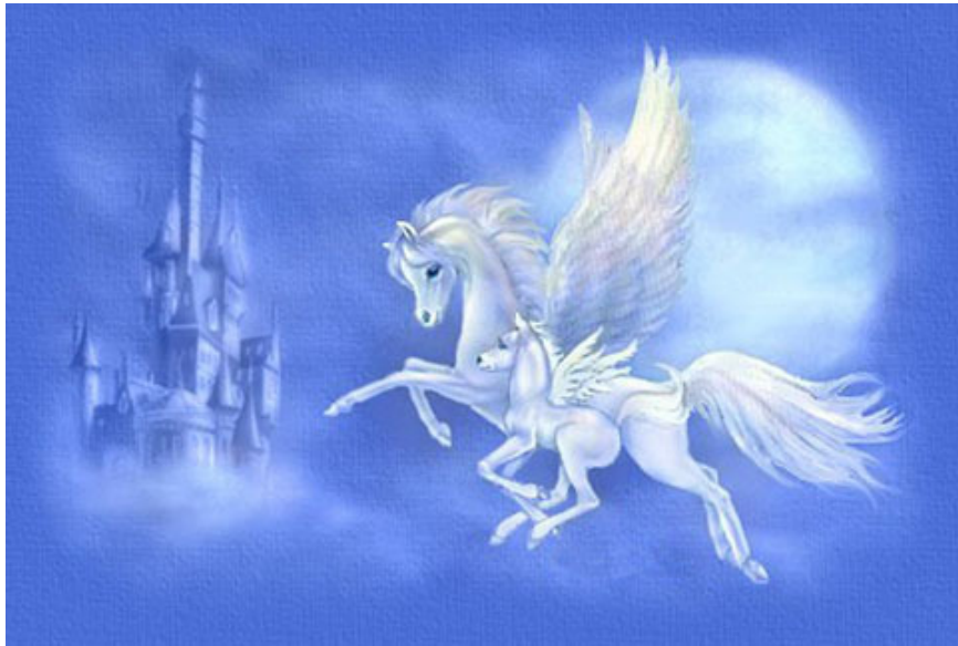
「海都市」在另一個世界見證著兒子的成功

接過打吡大賽冠軍獎盃時，勝利終於確實得握在了我的手中。獎盃是由一人兩馬組成的銅制雕塑，它不僅是精緻典雅的藝術品，更蘊含深遠的意義。