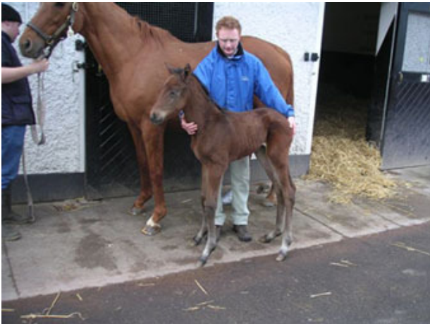
2006年4月6日，「海都市」和剛出生的「海都之星」

使命既已完成，回香港的旅程頓時變得輕鬆舒暢。我終於可以在飛機上靜下心來，懷念摯愛的「海都市」，細想她帶給我和家人的無比驚喜和愉悅。「海都市」已在三月去世，遺下兒子為她撰寫墓誌銘。「海都之星」不負所托，以輝煌的成就為母親的一生劃上了完美句號。