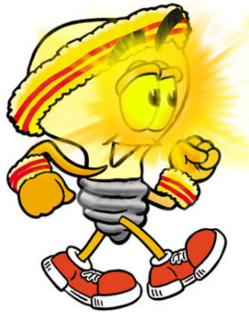
日文「Minoru」，意為「吾目之光」