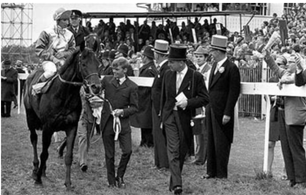
Blakeney在1969年的打吡大賽中勝出

Blakeney和Morston由同一匹母馬「詠妙女郎」(Windmill Girl)所生。奇妙的是，他們與「天文學家」和「海都之星」一樣，都是同母不同父。又是一個巧合。估計兩位約翰昨晚都忘記世界上還有第三匹曾生下兩匹打吡冠軍馬的母馬「詠妙女郎」了，不然他們不會放過我，也許會不屈不撓地追著我到男廁，繼續講述這匹母馬的傳奇。