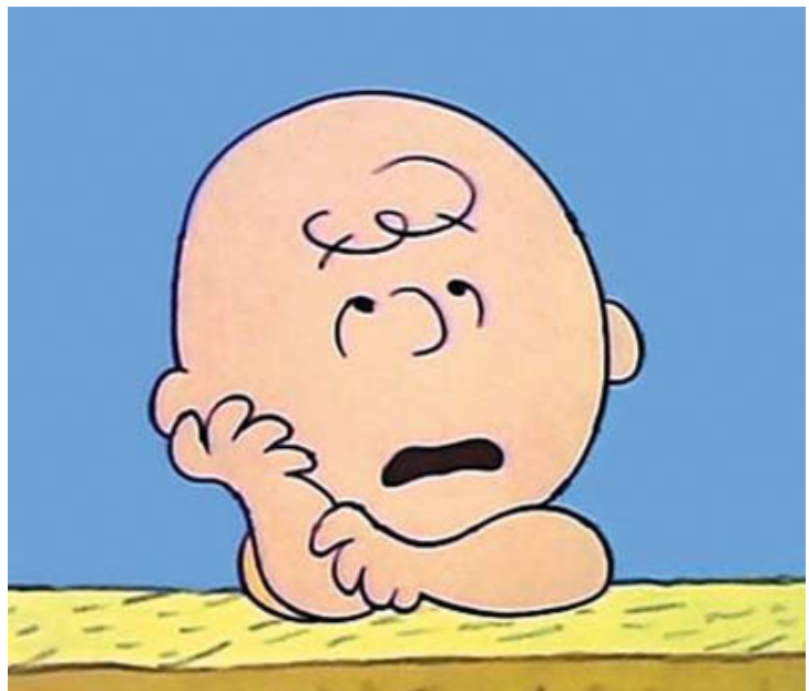
我的沉默寡言誤導了大家

此刻我深切懷念著「海都市」，她雖然已然離世，但我覺得她此刻一定在另一個世界見證著兒子的驕人成就。正是這個深得崔家厚愛的家庭成員，讓我的「靈」馬之夢得以成真。