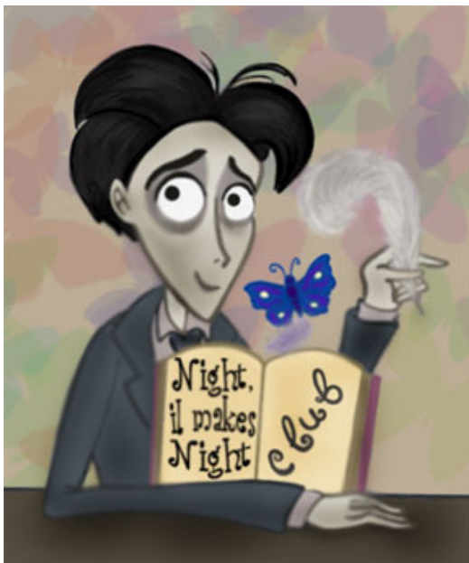
我不知道別人為何誤會我是夜總會老闆

我努力平復情緒，鎮定接受頒獎和訪問。不知為何，記者們得到錯誤消息，誤會我是夜總會老闆。我不知道這是什麼原因，或許是因為我生性內斂，不善辭令吧。也可能是我與倫敦帝國學院和卡斯商學院的朋友們組成了音樂協會的緣故，造成記者的誤會。