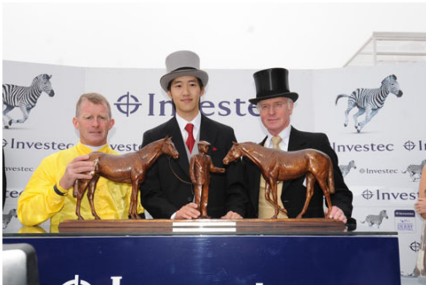
獎盃是由一人兩馬組成的銅制雕塑

接過打吡大賽冠軍獎盃時，勝利終於確實得握在了我的手中。獎盃是由一人兩馬組成的銅制雕塑，它不僅是精緻典雅的藝術品，更蘊含深遠的意義。