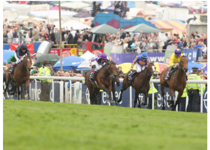
「海都之星」在2009年的葉森打吡大賽中勝出

「海都之星」會否再挑戰在唐卡斯特 (Doncaster) 舉行的聖烈治二里錦標賽 (St Leger)，成為三冠馬王呢？自從皇者尼真斯基 (Nijinsky) 在1970年創下這個紀錄後，便再沒有出現另一匹能連勝三關的馬。岳斯又一次用外交辭令應對媒體，言談模稜兩可，沒有清晰作答。而我仍沉醉于勝利的喜悅之中，還在反復仔細品味剛剛創下的輝煌成就：一個年僅二十七歲的年輕人，居然憑藉「海都市」的兒子勝出打吡大賽！