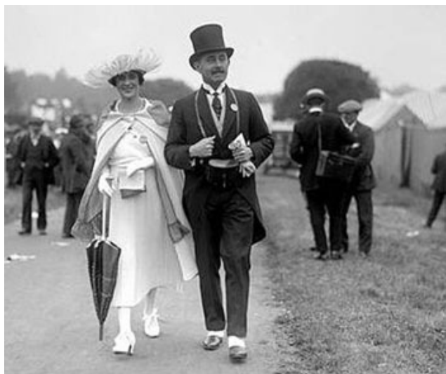
一百年前的英國皇家阿斯科特賽馬會 (Royal Ascot)

岳斯提前動身，去場地視探跑道的軟硬實際情況，只剩下約翰·克拉克在我身邊，於是克拉克又提起一百年前的愛爾蘭育馬傳奇，描述愛爾蘭育馬場是如何培育出一匹打吡大賽冠軍的。