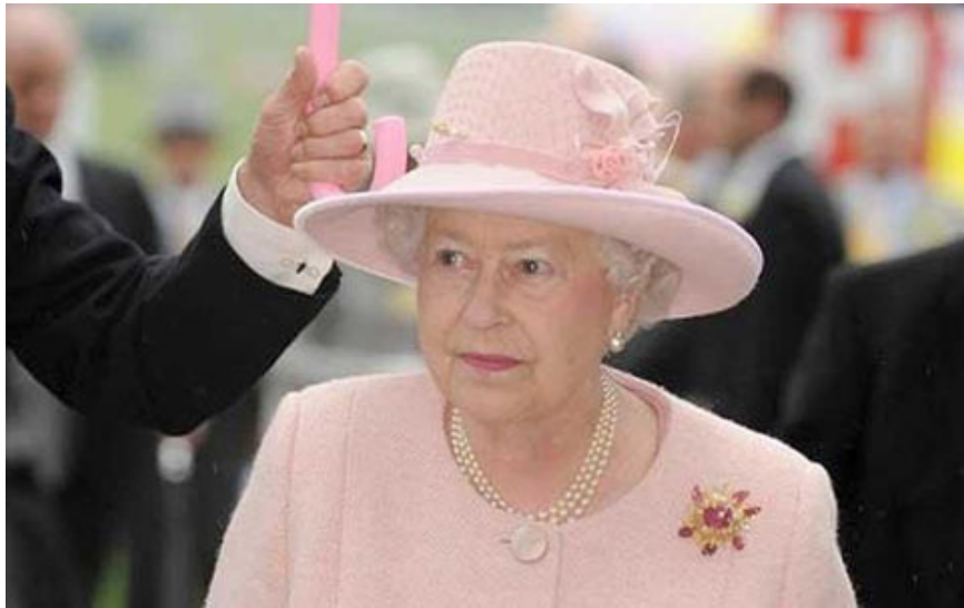
世上最具王者氣派，備受尊崇的君主

女皇接見了我，祝賀我成為她記憶中最年輕的打吡大賽冠軍馬主，氣氛輕鬆起來。女皇擁有豐富的賽馬和育馬知識，對「海都市」亦知之甚詳，瞭解她在馬場上和配種生涯中所創下的驕人紀錄。最遺憾的是女王旗下馬房的賽馬從未能為女皇勝出過打吡大賽及凱旋門大賽。