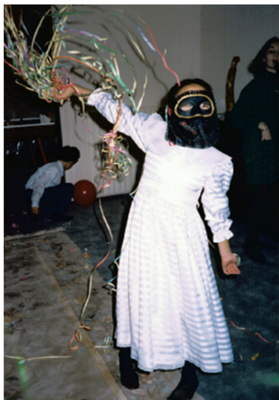
为增添神秘感，嘉心戴上嘉年华面具