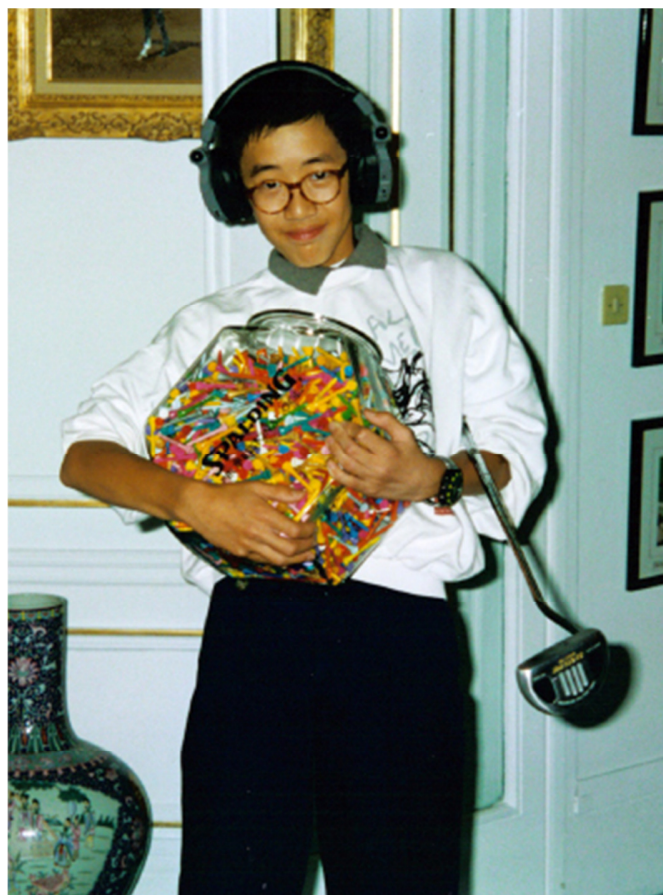
丈夫宝荣送给儿子的生日礼物，一千个高尔夫球钉