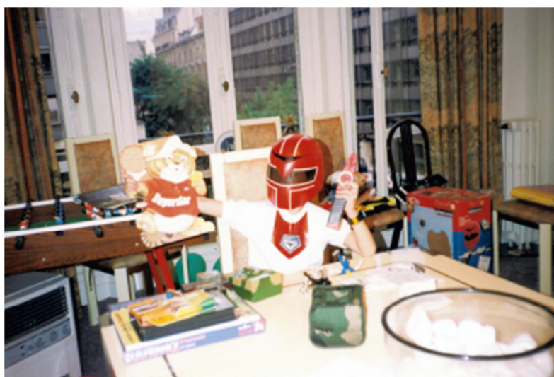
家亮也戴上他的超级战队面具，神气活现