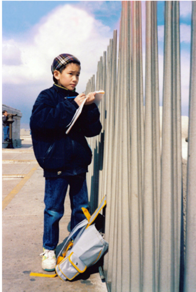
四处寻觅求索人生的意义

1990年，我在邻近的尚蒂伊（Chantilly）买入一批赛马。那时，若有人郑重其事地告诉家亮这件事情将完全改写他的一生，他必定会忽闪着眼镜框后面的一双灵动的眼睛，投去怀疑的目光。然而，万事玄妙，孰能先知，那时候谁又能料到我的一个小小的举动会对儿子的未来有如此深远的影响呢。