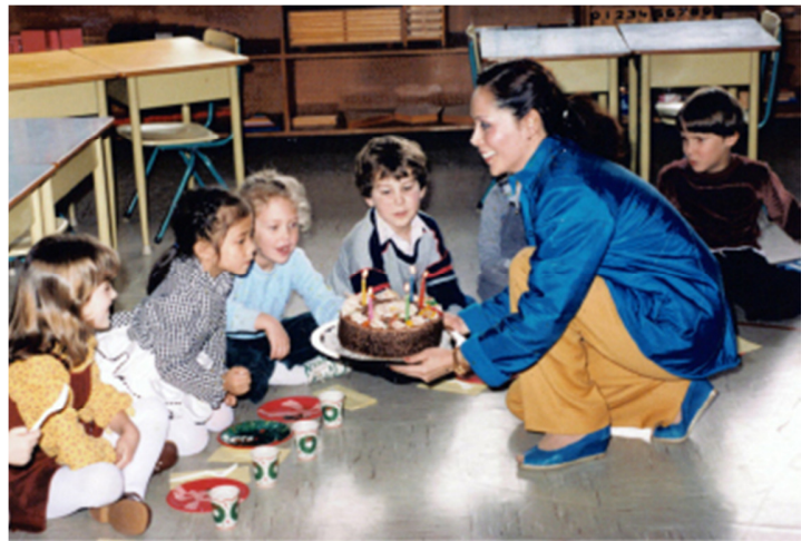
嘉心在金发小孩中间

我虽是人们眼中在职场拼杀的女强人，但是脱下套装还是个热爱烹饪的主妇。将新鲜食材精心烹饪，制作成各种美味佳肴，其过程乐趣无穷，更可让家人品尝我的手艺。全家人围坐桌旁，共聚天伦，此情此景，人生乐事！我的家，其乐融融，是我的乐土，人生的天堂。只不过苦了佣人，