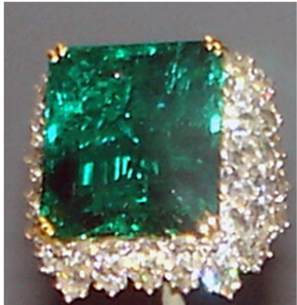
重达 37 克拉的“乔克绿（Chalk Emerald） 宝石”——藏于纽约国家历史博物馆