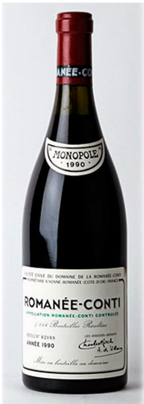
1990年，大瓶装罗曼尼康帝 (Domaine de la Romanee Conti) 以 17,460 英镑售出