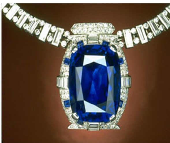
重达 98.6 克拉的“俾斯麦蓝宝石（Bismark