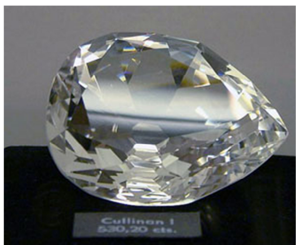
重达 530.2 克拉的“非洲之星”——藏于伦