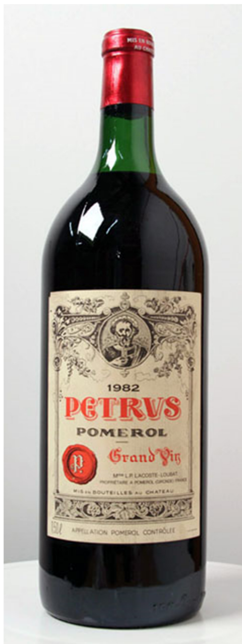
一箱 1982 年柏图斯红酒 (Chateau Petrus) 以 48,500 英镑出售