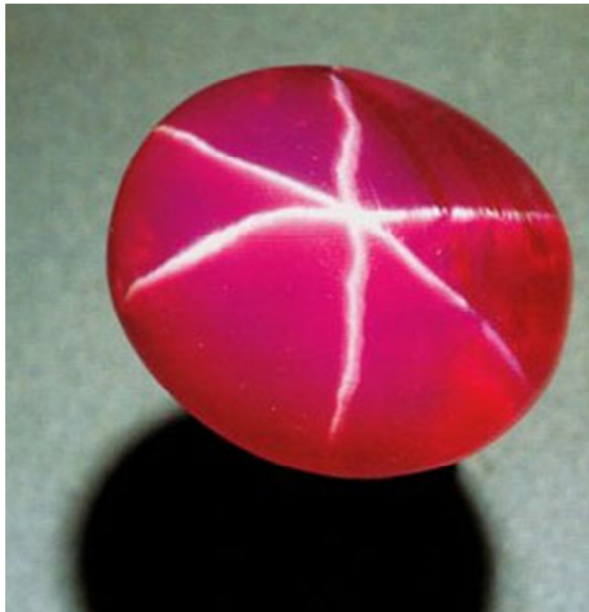
重达 100.32 克拉的“德隆之星红宝石”—— 藏于纽约国家历史博物馆

如果我认为要了解赛马，只需参加一个关于纯种马、赛马和育马的速成课程就可顺理成章地当了马主也不会有什么别的故事，那我就大错特错了。我有一位来自台湾的生意朋友，她个性古怪，是个宝石收藏家。她也想和泽田正彦一样，通过一番大举措，蜚声巴黎。