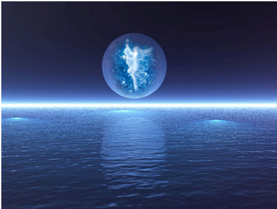
她是拍卖场上的明星，也是一颗海上明星

当“海都市”在 1992 年 10 月进入拍卖场时，她是带着很多荣誉的。她在五月隆尚的一场表列赛中胜出，八月又在多维尔举行的金伯爵表杯赛事胜出。正如大家所料，她的收购价一定很高，是那场拍卖会中的明星。