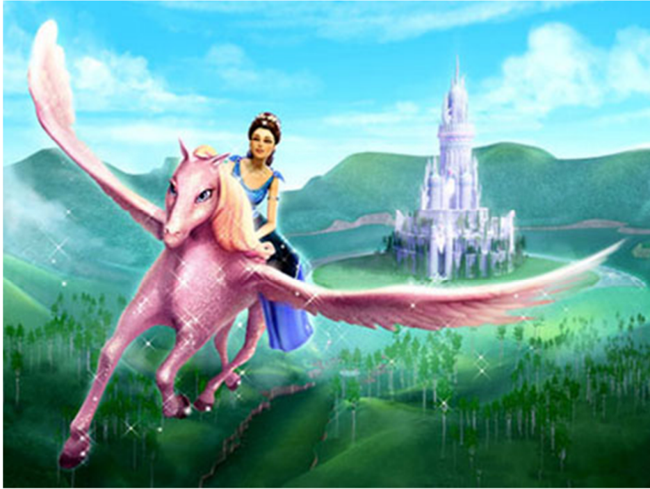
与飞马一起走进冒险新旅程

她在香港与一名国际著名骑师共进晚餐后，便不理睬我反对与否，坚持要入股这四十五匹马。她还说已签下这名骑师做她的欧洲赛事经理。