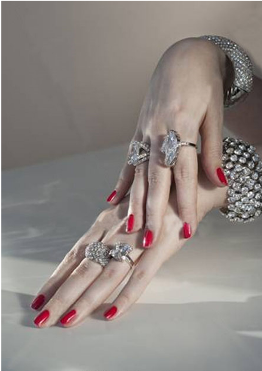
朋友与骑师握手，可谓“一握千金”