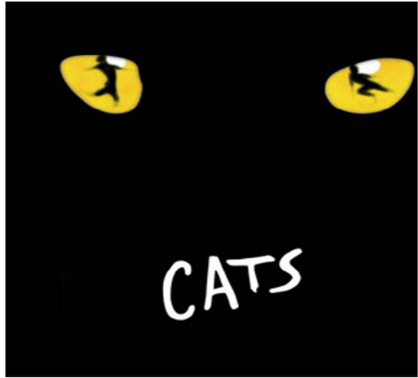
歌剧《猫》将会以普通话演绎，于全中国巡回演出

当“海都市”在 1992 年 10 月进入拍卖场时，她是带着很多荣誉的。她在五月隆尚的一场表列赛中胜出，八月又在多维尔举行的金伯爵表杯赛事胜出。正如大家所料，她的收购价一定很高，是那场拍卖会中的明星。