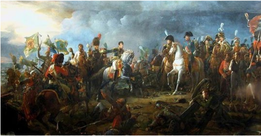
拿破仑的最大胜利是赢得三皇之战