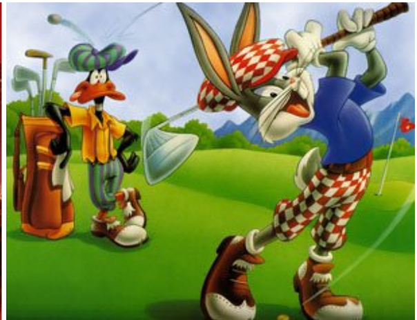
家亮的下一个目标：高尔夫球