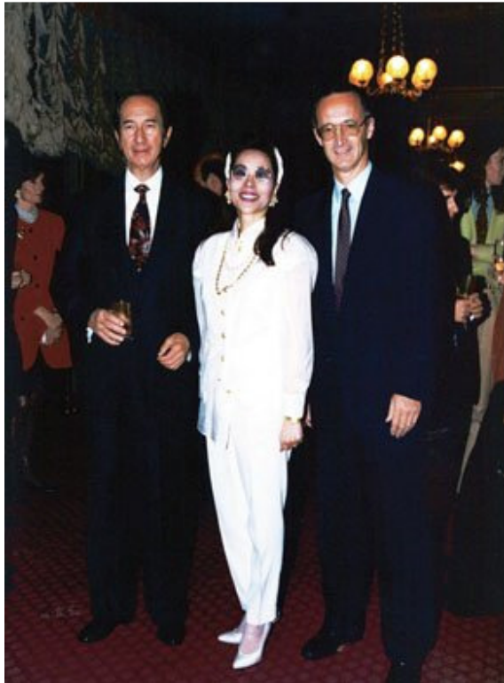
澳门赌王何鸿燊、崔黄紫灵和法国赛马会总裁 Romanet（1993年10月）