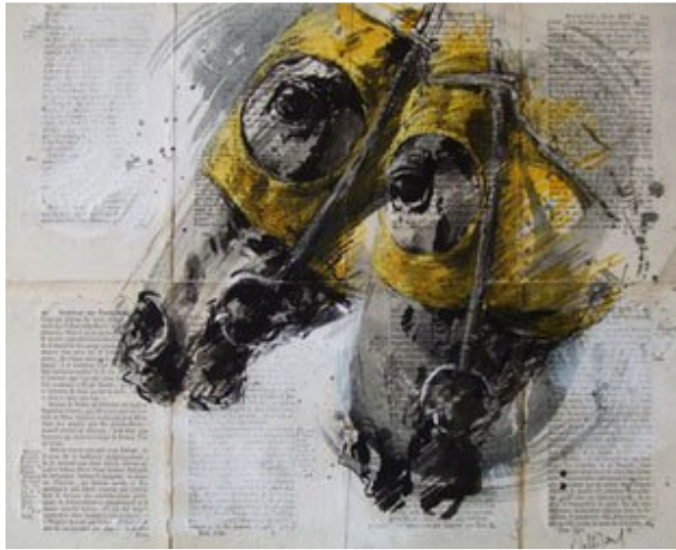
Hubert de Watrigant 的黄色眼罩油画