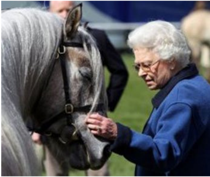
英女皇伊利莎伯二世于皇家温莎轻抚她的马匹