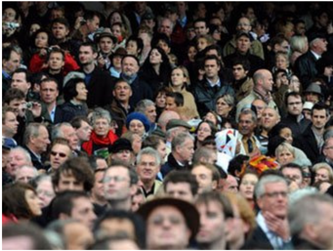
隆尚凯旋门大赛日