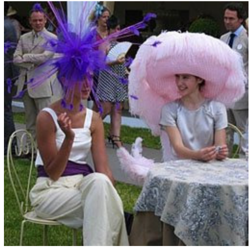
淑女们出席盛会，衣着华丽