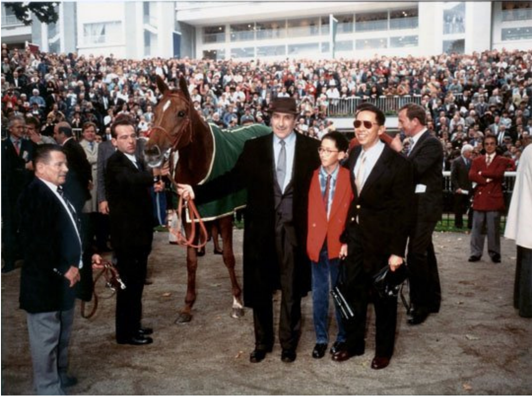
家亮对“海都市”钦佩不已

我们一群团队里唯一保持冷静的只有“海都市”，她在喧嚣之中依然举止庄重。在她看来，她不过就是完成了周围的人不断要求她完成的使命而已。