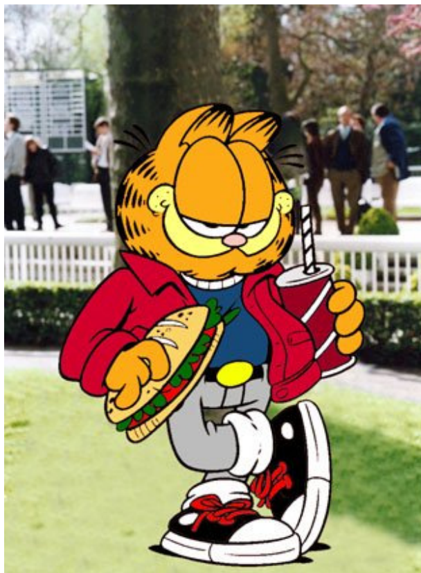
家亮早已把自己当作隆尚的熟客