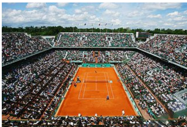
罗兰加洛斯网球场