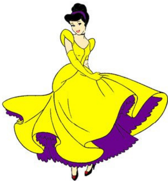
真正的灰姑娘故事