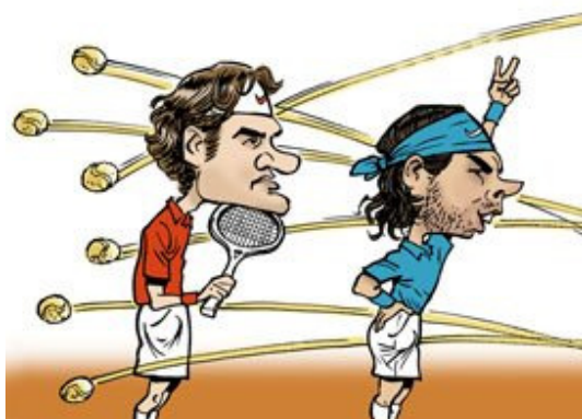
罗兰加洛斯网球场决赛日

人们都言辞激动，热切预测大赛结果。当然不是每个人都密切关注大赛，还有一些人因为自己的马匹参加其他赛事，所以注意力稍转。但几乎没人关心他们的喜乐，大家的注意力都在大赛上。