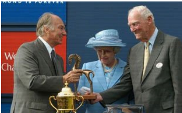
阿迦汗王子从英女皇手中接过奖杯