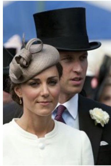
皇室人员出席叶森打吡大赛