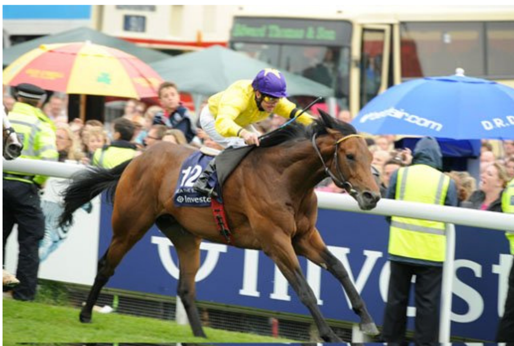
十六年后，“海都之星”也是以编号 12 号出战叶森打吡大赛。