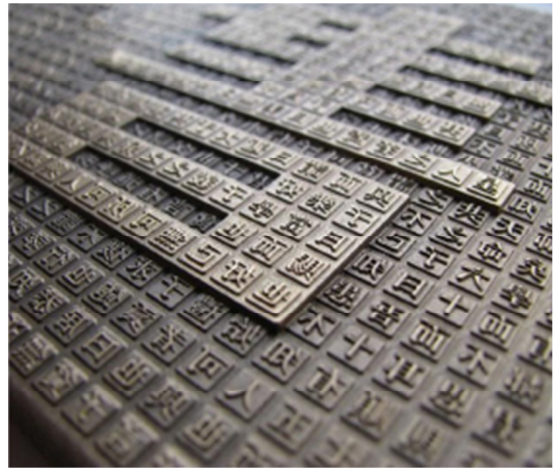
古代中国发明：印刷术

儿子渐渐长大，他对于马的热爱有增无减。他开始了解许多有关御马高手蒙古人的传奇故事。马可波罗（Marco Polo）曾说过：“蒙古人可连续策骑十日，期间刺穿马匹身上的血管，饮用马血来维持生命。”对一个小男孩儿来说，这样的故事实在是引人入胜。我给儿子买的第一本书是安托万（Antoine de St Exupery）的名著《小王子》。故事中的小王子通过一次奇幻旅程发现了自我及生命的意义，这个故事对年幼的崔家亮启发很大。他之后应对挑战时便常想若是小王子处理的话会如何面对同样的挑战，并常觉小王子的遭遇与自己的经历颇有相似之处。他们之间的关系，仿佛超越了语言，而进入一种精神层次上相融相通的境界了。对崔家亮来说最重要的时刻，莫过于他明白“查真相非用眼观，唯需用心感知”这个道理。他渐渐清楚地知道，在浩瀚宇宙中自己虽渺小如一粒纤尘，却仍可以为改善这个世界而做出贡献，不仅惠及自己，更可造福他人。