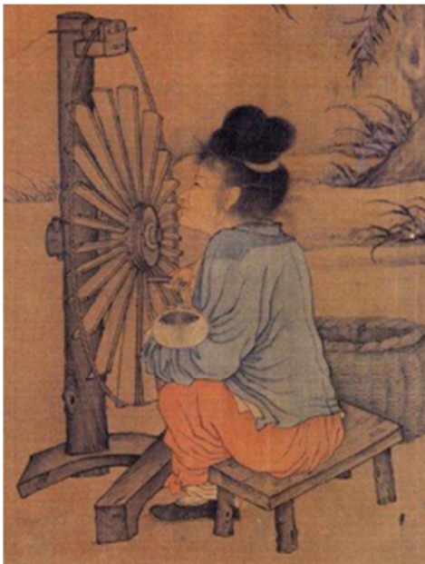
古代中国发明：纺车

或许是因为地理及气候不适宜繁殖和培育马匹之故，马匹在中国显得尤为珍贵。中国历史上，为了抵御外敌，特别是蒙古人，国家常常四处寻觅良驹，甚至不惜花费巨资向邻国购入马匹。除此之外，中国人更发明了三种有效控制马匹的工具——马鞭、马龙头及脚蹬。当然，中国人更闻名的发明无疑是造纸术和火药。