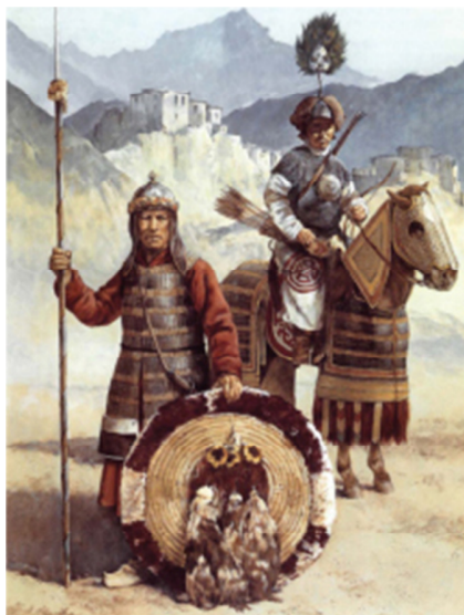
马背上的蒙古人（昔日）