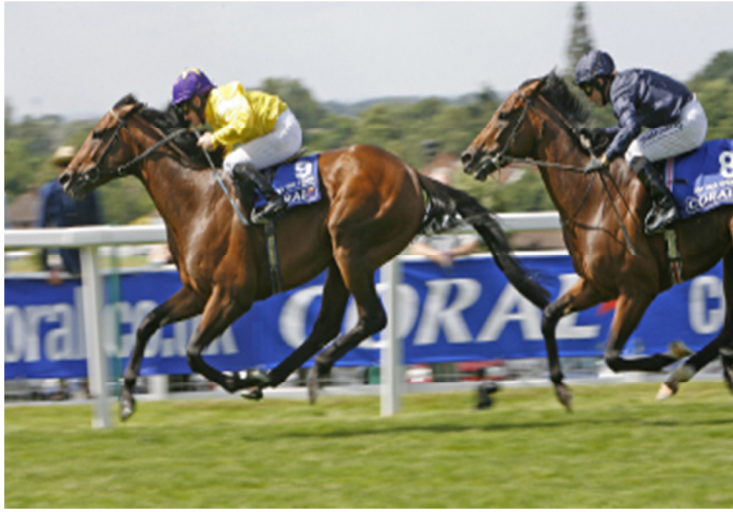
2009年，“海都之星”在英国日蚀一级赛中远超对手，勇夺桂冠。