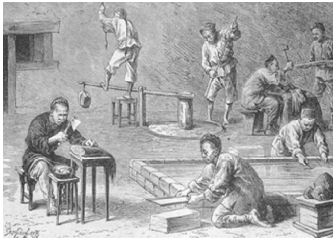
造纸厂早在汉朝就已出现