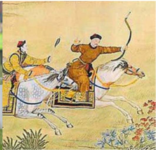
中国皇帝在围猎赛中的胜负取决于其座驾千里马的速度

年年春节，都能看出马在中国人心中的重要性。每逢农历春节，家家户户都要贴上喜庆的红色春联。春联上骏马奔腾，意喻“马到成功”。据说，马匹可带着马背上的人安抵极乐世界。