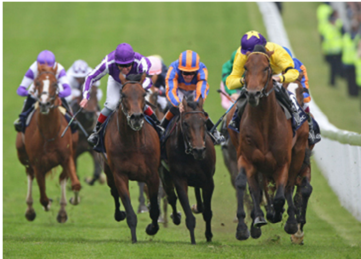
欧洲赛马亦以马匹的速度决胜