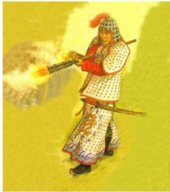
古代中国发明：火药