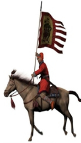
昔日，马匹就如中国人的徽章、勇士的王牌