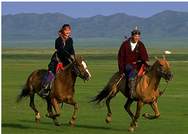
马背上的蒙古人（今日）