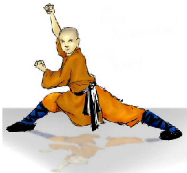
Un Chinois : Kung Fu

M. Lesbordes, me conduisant dans les couloirs des écuries, me présentait un à un les membres de ma nouvelle « famille », par leurs noms et leurs pédigrées. A mon grand étonnement, beaucoup d'entre eux portaient Urban comme préfixes : Urban Marzina, Urban Mayoko, Urban Sky, Urban Dancing, etc. La seule association qui semblait harmonieuse à mes oreilles était le nom du premier cheval qui m'avait été présenté, – Urban Sea. Deux images me venaient à l'esprit : Chevaux de la Mer et Fée de la Mer.