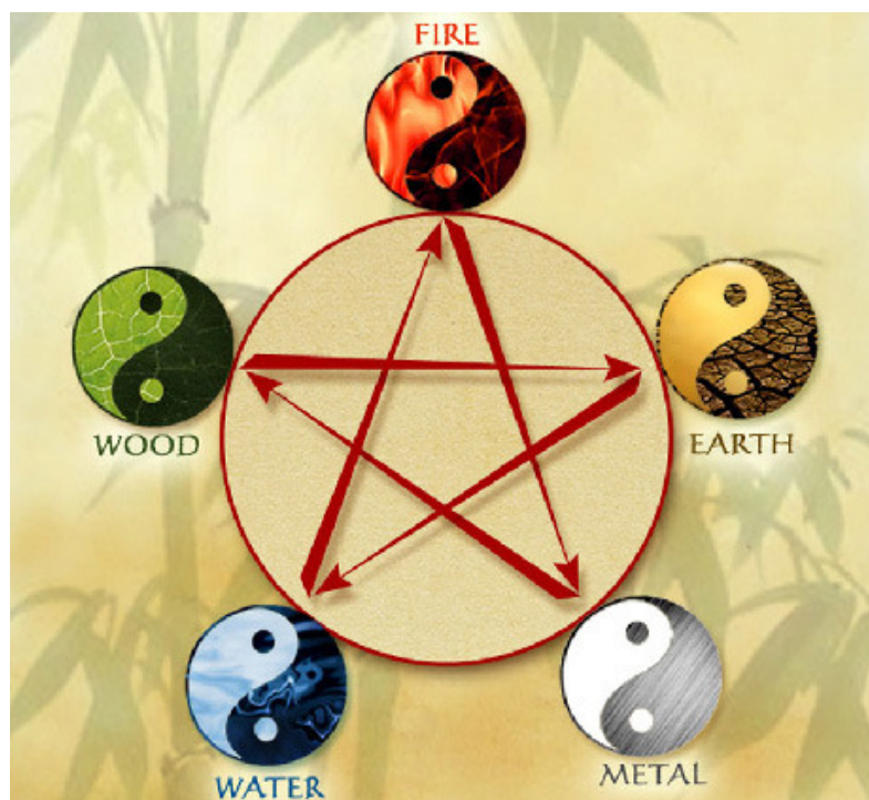
La loi chinoise des cinq éléments : l'or, le bois, l'eau, le feu et la terre

Placée devant le fait accompli et sans illusions, j'ai simplement répondu que le seul nom qui me semblait acceptable était celui d'Urban Sea, pour la raison qu'étant née sous le signe chinois de la Terre, elle avait besoin de l'Eau pour fertiliser mes entreprises.