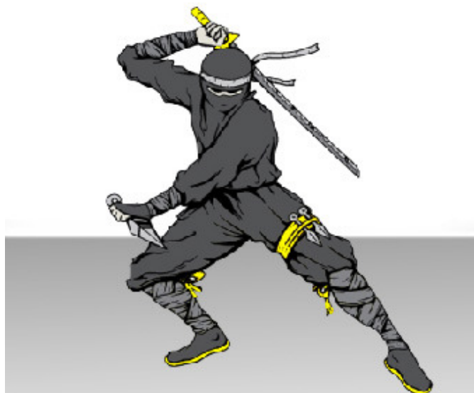
Peut-être dans l'esprit d'un Français – un Ninja japonais