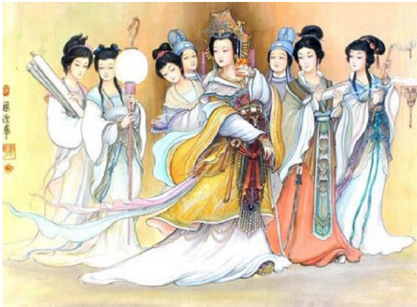
Wu Zetian, la seule impératrice de l'histoire de la Chine (618-906 avant JC)