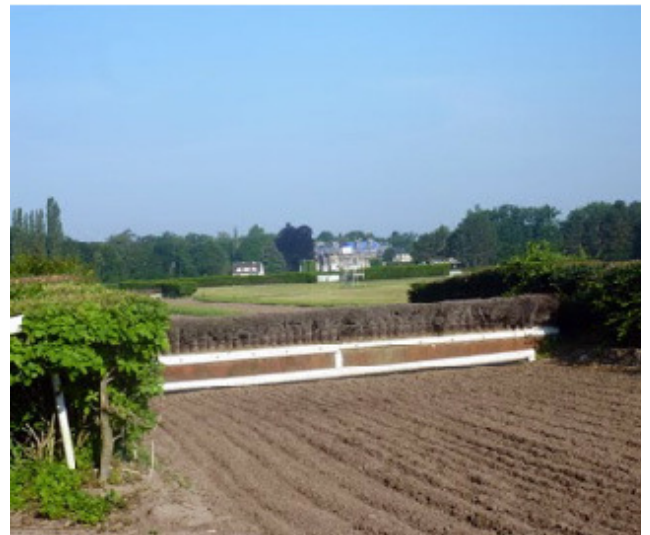
Centre d'apprentissage d'obstacles à Lamorlaye

Pierre aurait aussi bien pu comparer avec Newmarket en Angleterre et le Curragh en Irlande, mais pour moi ce n'étaient que des noms de lieux qui ne me disaient rien. Rappelons-nous que nous étions en 1990, au tout début d'une courbe d'apprentissage raide mais rapide : mon premier pas dans un monde qui m'était encore extérieur.