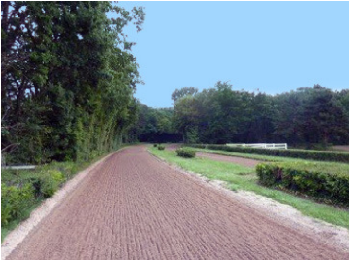
La piste de galop de Lamorlaye