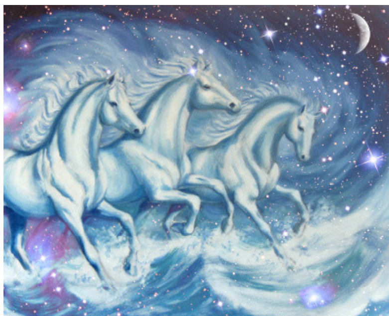
Chevaux de la Mer, chevaux des empereurs de Chine

M. Lesbordes, me conduisant dans les couloirs des écuries, me présentait un à un les membres de ma nouvelle « famille », par leurs noms et leurs pédigrées. A mon grand étonnement, beaucoup d'entre eux portaient Urban comme préfixes : Urban Marzina, Urban Mayoko, Urban Sky, Urban Dancing, etc. La seule association qui semblait harmonieuse à mes oreilles était le nom du premier cheval qui m'avait été présenté, – Urban Sea. Deux images me venaient à l'esprit : Chevaux de la Mer et Fée de la Mer.