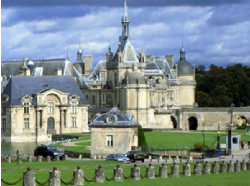
Ecuries de Lamorlaye