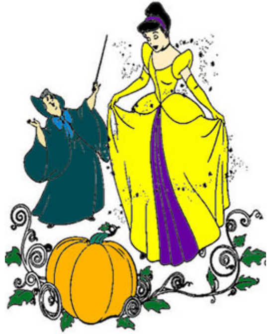
La Fée lui avait déjà dit que c'était son destin