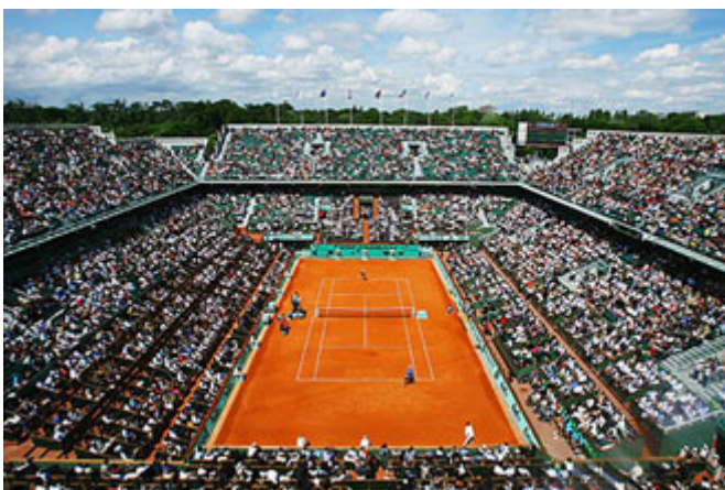
Le court central de Roland Garros

On pouvait comparer cette atmosphère avec celle du court central de Roland Garros le jour des finales.