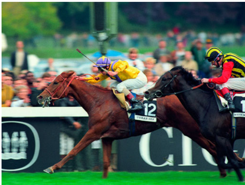
Urban Sea porte le numéro 12 à l'Arc en 1993

Mon équipe a assisté à la course – pour tout ce qu'ils pouvaient en voir – depuis le box 128. Urban Sea portait le numéro 12, que porterait Sea The Stars dans le Derby d'Epsom. On a dit que cela a été une affaire très brutale. Je n'en sais rien. Tout ce que je sais et que je n'oublierai jamais, c'est que quand toute la masse de chevaux a chargé vers le poteau d'arrivée, une casaque jaune a glissé à la corde pour le passer en tête : Urban Sea avait gagné le Prix de l'Arc de Triomphe.