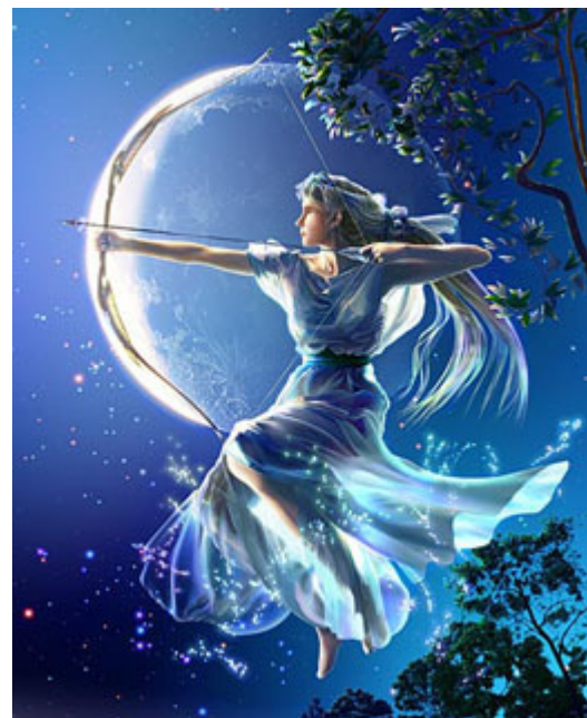
Mon ange est maintenant prêt à tirer ses flèches