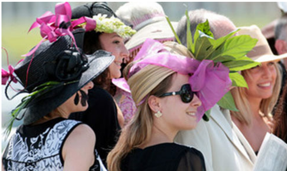
Le jour de l'Arc, sommet de la mode

On pouvait comparer cette atmosphère avec celle du court central de Roland Garros le jour des finales.