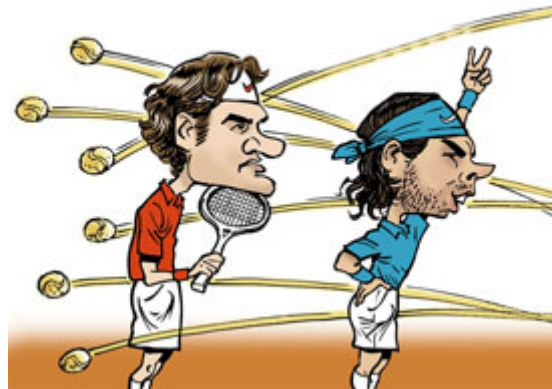
La finale de Roland Garros