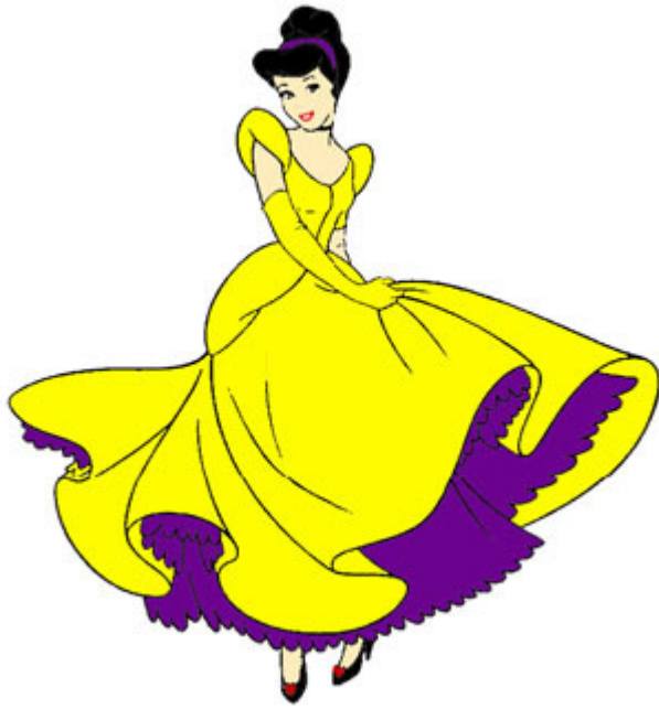
La véritable histoire de Cendrillon