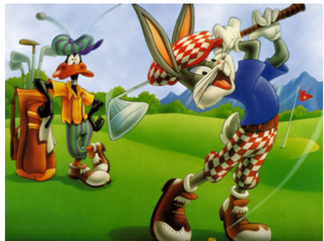
Prochaine aventure de Christophe : le golf !

* M. Lesbordes = Monsieur Lesbordes in French