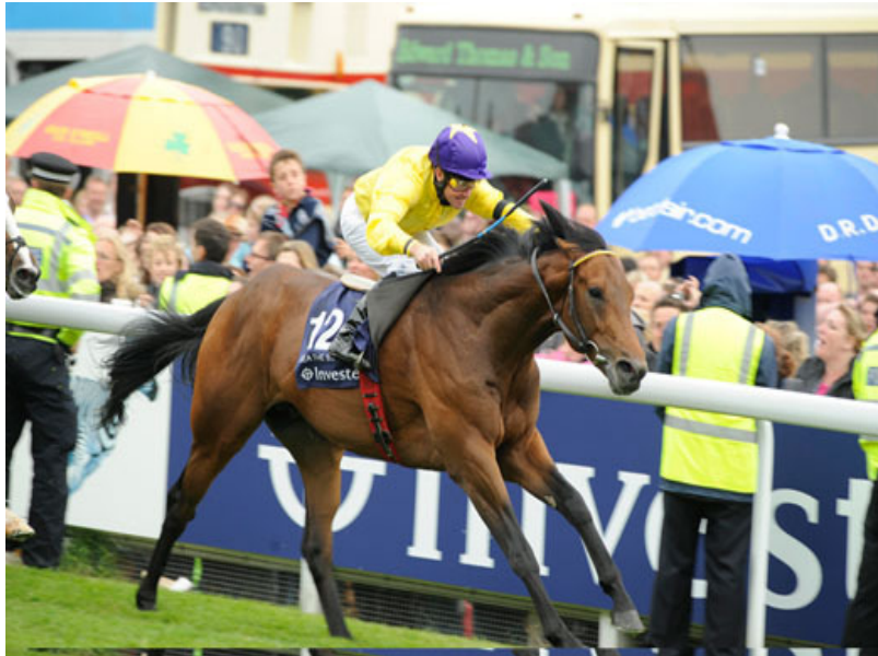
Seize ans plus tard, Sea The Stars porte le même numéro 12 au Derby d'Epsom