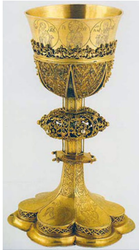
Le Saint Graal

Mon équipe a assisté à la course – pour tout ce qu'ils pouvaient en voir – depuis le box 128. Urban Sea portait le numéro 12, que porterait Sea The Stars dans le Derby d'Epsom. On a dit que cela a été une affaire très brutale. Je n'en sais rien. Tout ce que je sais et que je n'oublierai jamais, c'est que quand toute la masse de chevaux a chargé vers le poteau d'arrivée, une casaque jaune a glissé à la corde pour le passer en tête : Urban Sea avait gagné le Prix de l'Arc de Triomphe.