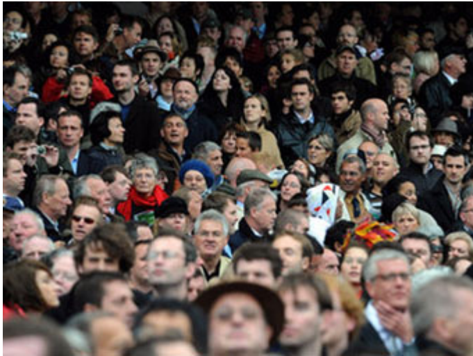
Le jour de l'Arc à Longchamp