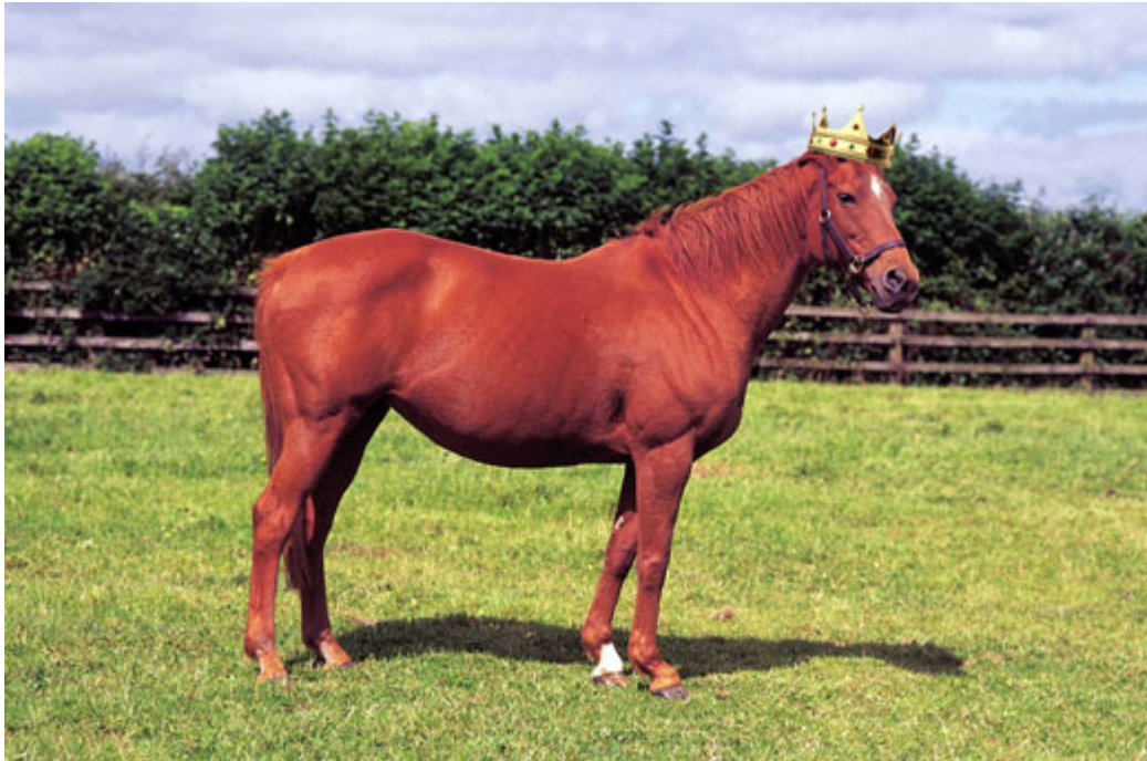
La lignée d'Urban Sea domine l'industrie européenne des courses et de l'élevage

Peut-être, mais il avait bien fallu à notre pouliche dédaignée repousser White Muzzle, Opera House, Intrepidity et Only Royale, dans l'ordre d'arrivée. Était-ce là une « petite » performance, et qui pouvait prévoir que ces « petites gens » gagneraient à nouveau l'Arc seize ans plus tard avec le fils d'Urban Sea, Sea the Stars, le « cheval d'une vie » pour rendre envieux rois et reines ? Aujourd'hui, la descendance d'Urban Sea domine l'industrie européenne des courses et de l'élevage.