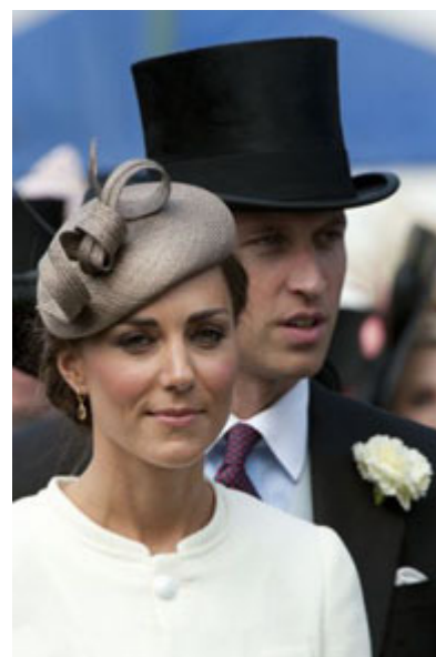
Elégances royales à l'Epsom Day