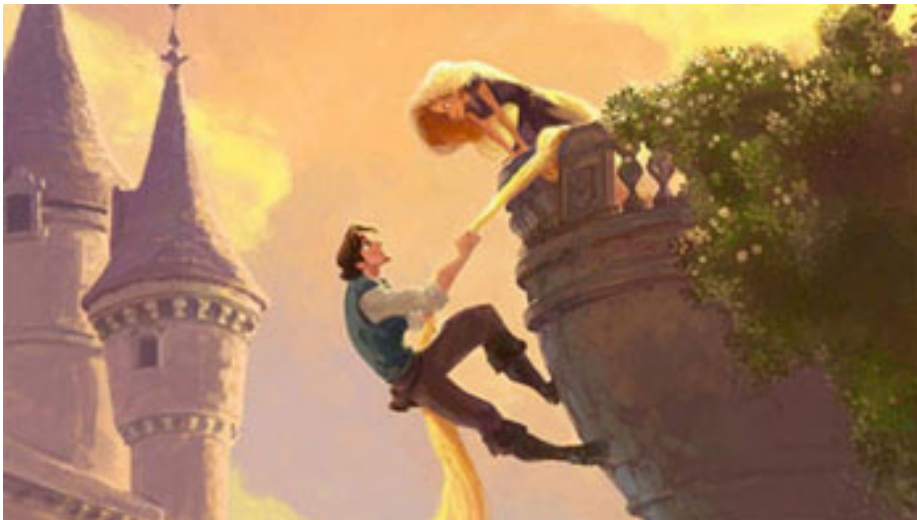
Raiponce utilisant ses cheveux pour remonter son prince