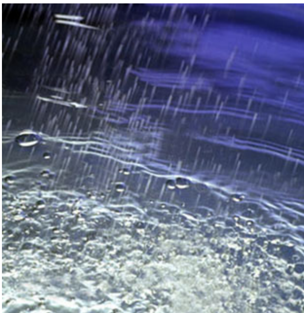
Enfin la pluie

Une heure avant la grande course, le ciel a craqué, arrosant le terrain. M. Lesbordes était en extase.