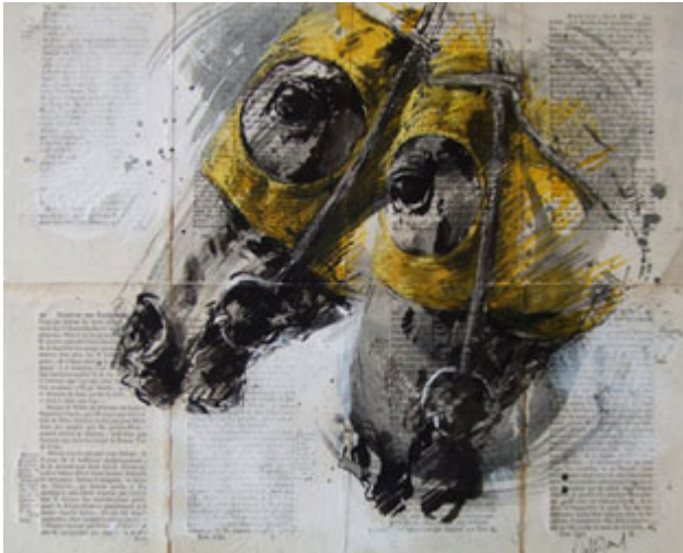
Jaune, par Hubert de Watrigant