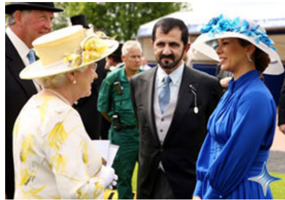
SM la Reine Elizabeth II à l'Epsom Day avec Sheikh Mohammed et SAR la Princesse Haya

Il était tellement ému par le spectacle que ce jour allait marquer sa jeunesse pour tant de raisons. Il s'approchait de l'héroïne du jour – Urban Sea – et l'embrassait sur les naseaux.