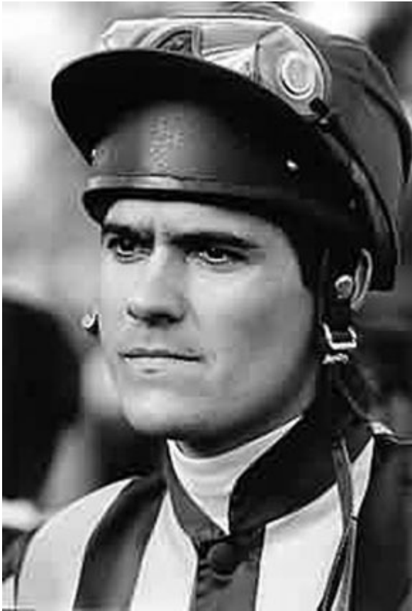
Cash Asmussen, le jockey le plus recherché