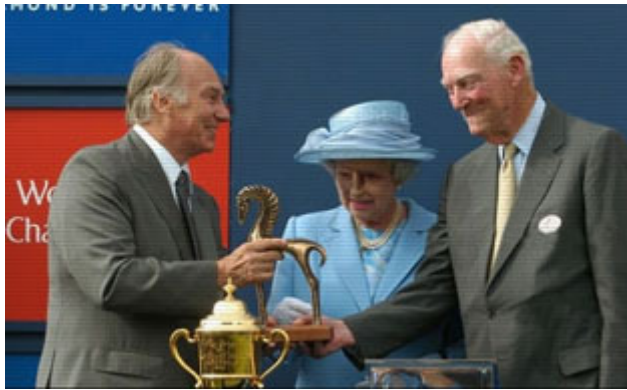
SA l'Aga Khan reçoit son trophée de SM la Reine