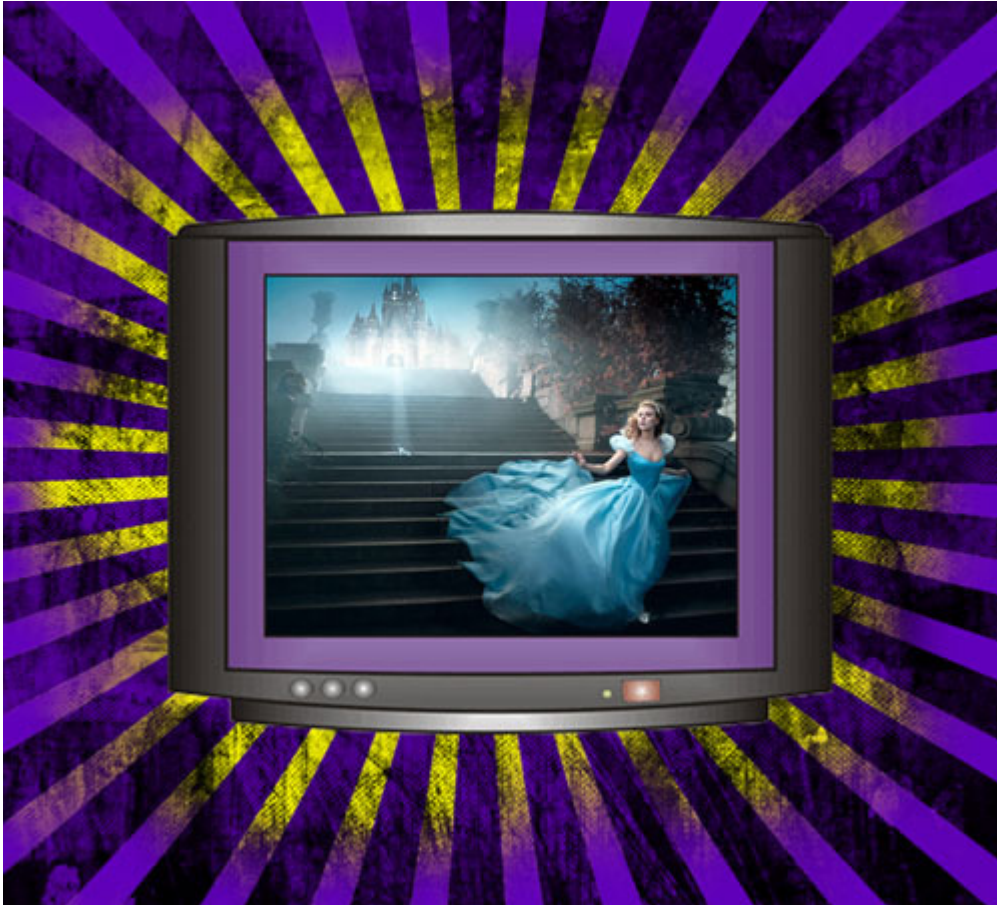
Histoire de la moderne Cendrillon