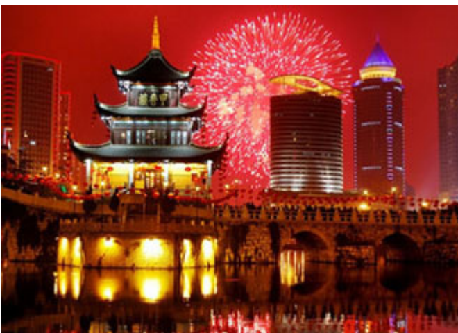
La fête pendant des jours et des mois

Nous avons fait la fête pendant des jours, des semaines même. Si l'on vous avait dit alors qu'il se passerait quelque dix ans avant que mon héritier remette les pieds sur un champ de courses, vous auriez cligné des yeux, et ne l'auriez cru. Mais il devait en être ainsi.