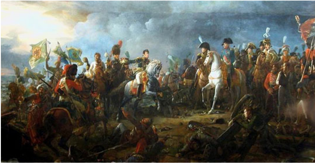
Napoléon et son plus grand triomphe : la bataille des Trois Empereurs