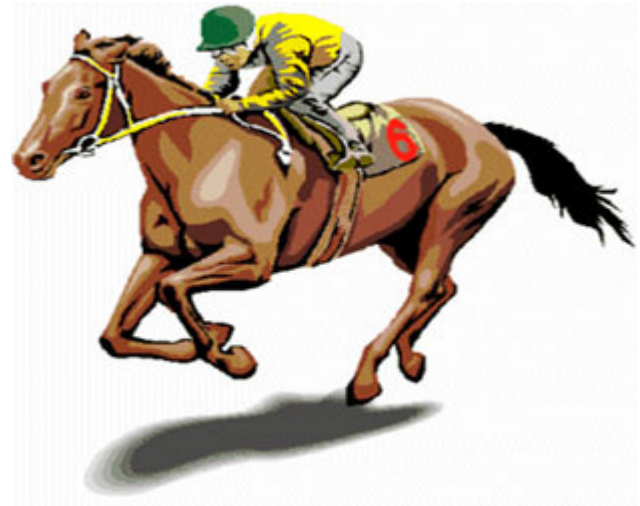
Un cheval gagnant, casaque jaune, le jour de l'Arc, dans le journal