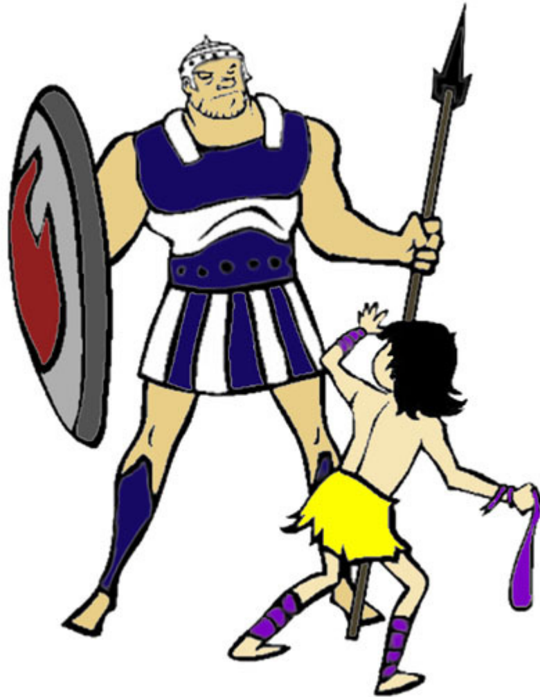
David contre Goliath