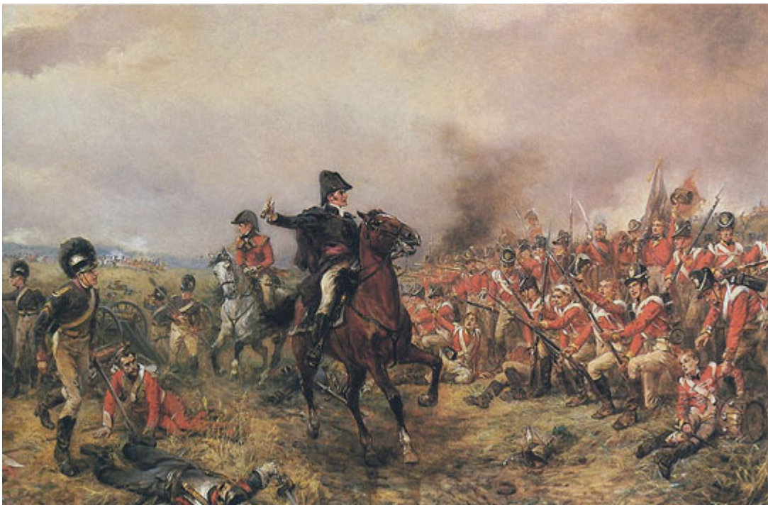
Napoléon, battu à Waterloo : traitement inégal des deux imposteurs ?

Ce à quoi mon héritier ne s'attendait pas, c'était l'extraordinaire atmosphère que le jour de l'Arc provoque à Longchamp. Le frisson dans l'air est presque palpable ; la langueur des autres jours à Longchamp a disparu.