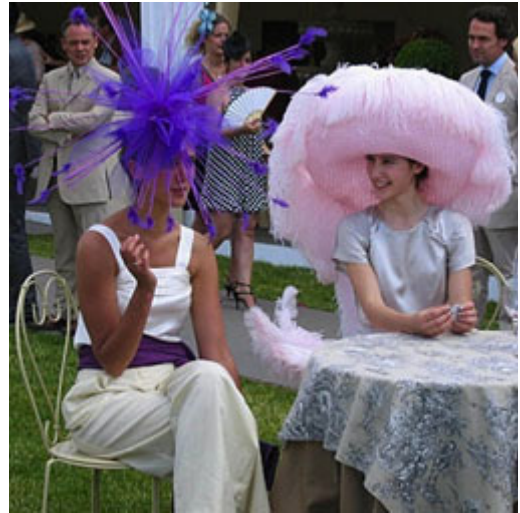
Magnifiques accessoires féminins lors des courses