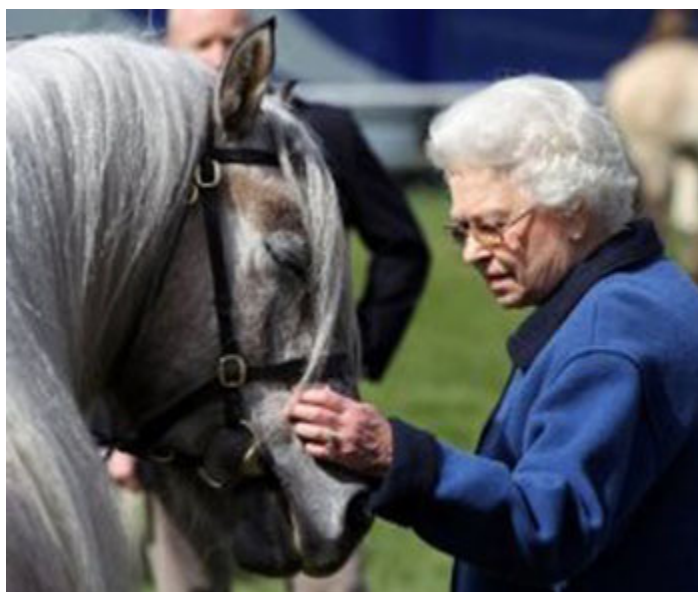
SM la Reine Elizabeth caresse son cheval lors du Royal Windsor

Mon fils avait vu que sur le champ de courses, le cheval est roi, ou reine, selon le cas ; et que le jour où on l'oubliera sera un triste jour pour le « Sport des Rois ».