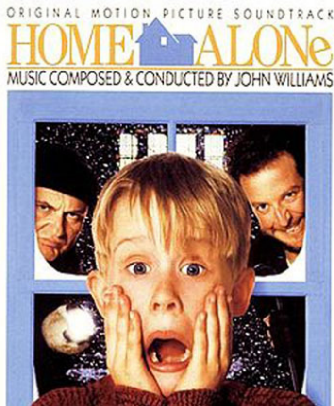
Home Alone, 1990, avec Macaulay Culkin

Essayez d'imaginer un garçon chinois de onze ans, ayant du mal à trouver son chemin vers le rond des vainqueurs. Un de mes amis l'a reconnu et guidé en toute sûreté à travers la mêlée d'après course vers ce cercle magique. J'avais fait des cauchemars après avoir vu en 1990 le film Home Alone avec Macaulay Culkin et je n'arrivais pas à croire que semblable chose pourrait arriver à mon héritier !