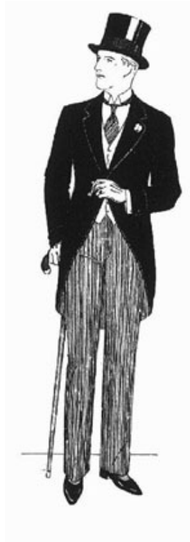
Les gentlemen doivent porter l'habit dans l'enceinte à Epsom au Derby Day