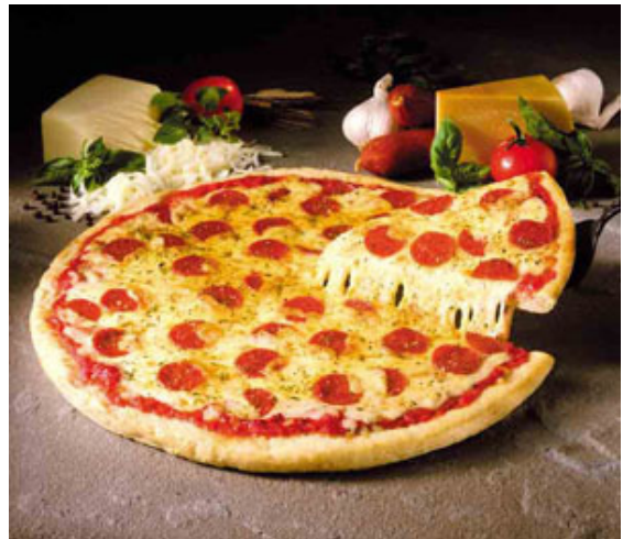
La pizza que j'adore