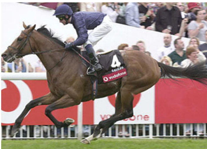
Galileo, né en 1998 de Sadler's Wells par Urban Sea

La seconde jument à avoir produit deux vainqueurs du Derby était plus intéressante : Galtee More (1897) et Ard Patrick (1902), les deux par la même Morganette mais par des étalons différents. Galileo est par Sadler's Wells. Sea The Stars est par Cape Cross.