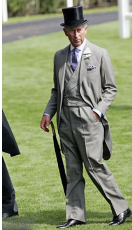
SAR le Prince Charles à Epsom le jour du Derby

Après quoi j'avais fait les magasins dans des quartiers plus familiers de Knightsbridge où j'avais vécu avec ma mère et Christine à l'époque universitaire de la CASS Business School jusqu'à mon master en 2008, pour la plus grande joie de ma mère.