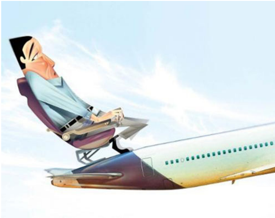
La tension, la peur, le poids de l'attente

Mais je suis bien arrivé pour le Derby, et même deux jours avant la grande course. Je suis descendu au Mandarin Oriental de Knightsbridge.