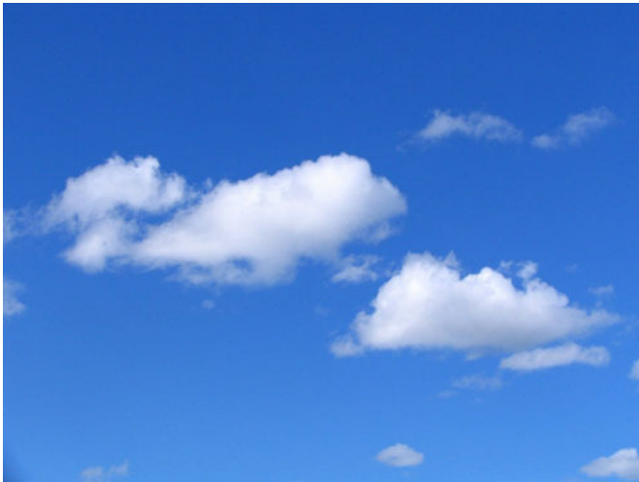
Nous avons besoin de beaucoup de soleil