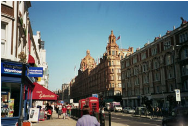
Knightsbridge, paradis des acheteurs