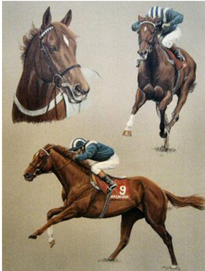
Nashwan, le dernier cheval à gagner le doublé Guinées-Derby vingt ans plus tôt