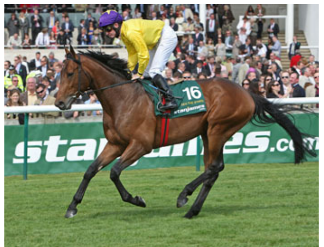
Sea The Stars, né en 2006 de Cape Cross par Urban Sea

Sea The Stars pourra-t-il demain égaler Nashwan ? Urban Sea pourra-t-elle égaler Perdita II du Roi King Edouard VII ? De grâce, pourrait-il ne pleuvoir qu'après le Derby ?