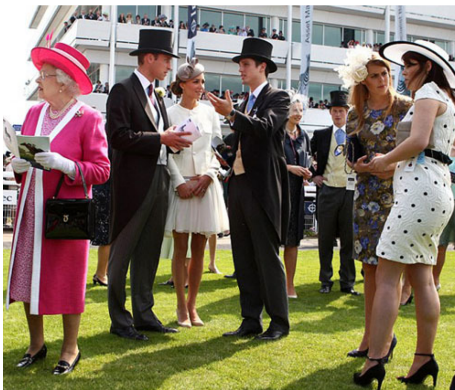
Sa Majesté la Reine d'Angleterre honore chaque année de sa présence le jour du Derby

La tension, la peur, l'oppression de l'attente, le risque effroyable de l'échec, tout cela m'a tourné vers Confucius pour me consoler : « Mieux vaut, dit le sage, le voyage plein d'espoir que l'arrivée à son terme ».