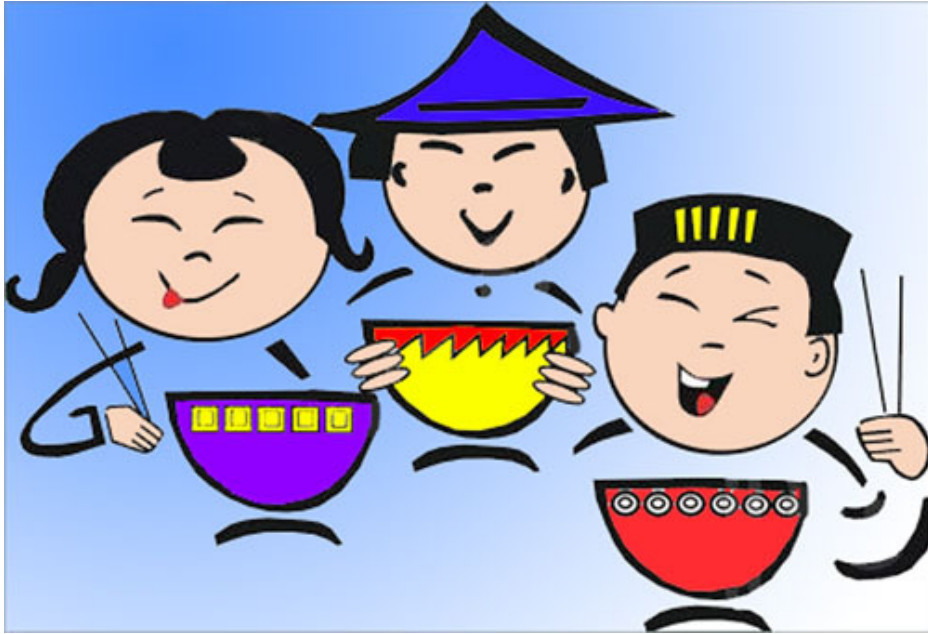
Diner avec un client chinois