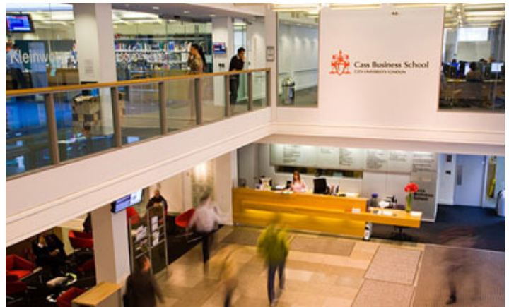
Grand hall de la CASS Business School