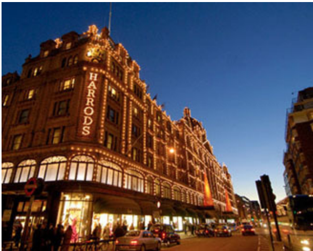
Le célèbre grand magasin Harrods de Knightsbridge

L'un de ces principaux talents que j'ai rejeté, c'est la cuisine. J'adore les pizzas, et je m'en suis régalé à la pizzeria de Harrods.