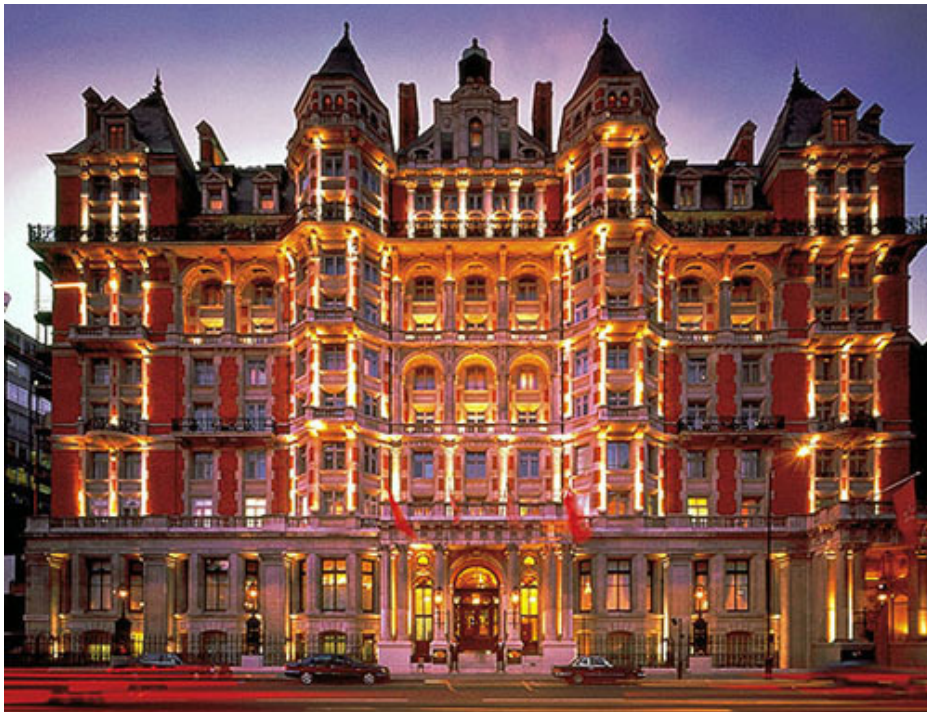
Hôtel Mandarin Oriental à Knightsbridge, Londres

Mais je suis bien arrivé pour le Derby, et même deux jours avant la grande course. Je suis descendu au Mandarin Oriental de Knightsbridge.