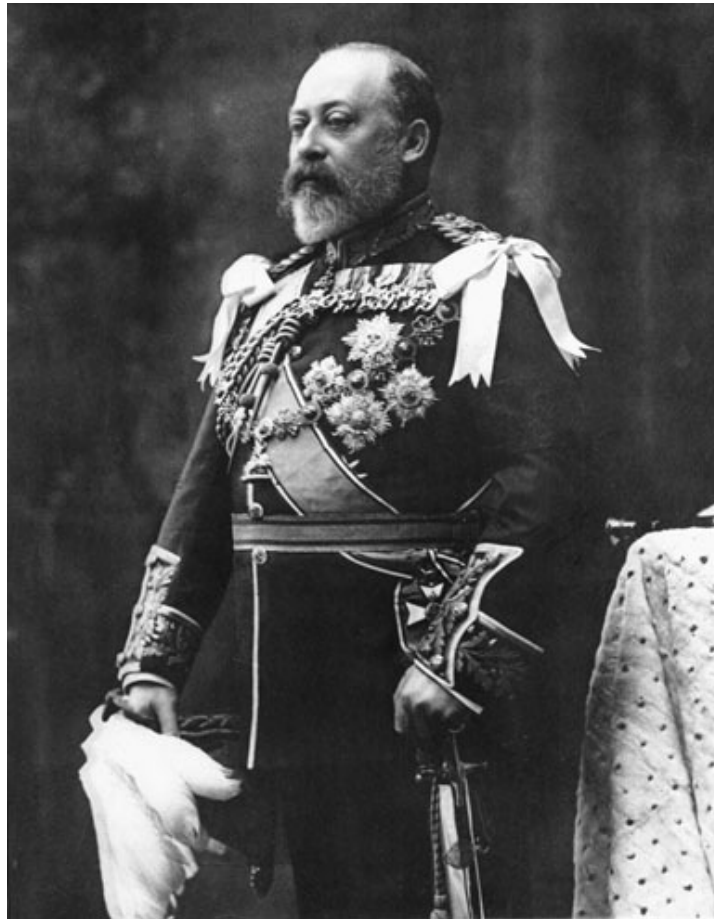
L'arrière-grand-père de Sa Majesté la Reine, le Roi Edouard VII, a gagné le Derby par deux fois en 1896 et en 1900, avec deux fils de la même Perdita II

La seconde jument à avoir produit deux vainqueurs du Derby était plus intéressante : Galtee More (1897) et Ard Patrick (1902), les deux par la même Morganette mais par des étalons différents. Galileo est par Sadler's Wells. Sea The Stars est par Cape Cross.