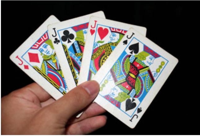
Ma mère, la « femme à tout faire »