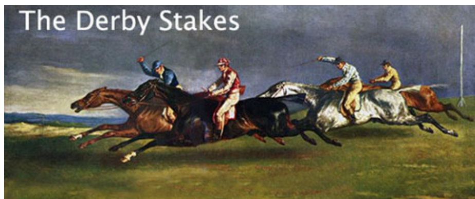
Derby, Le Ruban Bleu du Turf

Je n'aime pas les vols de longue distance, et pas seulement parce que je mesure 1,85 m. Ils vous laissent trop longtemps seuls avec vos pensées. Celui-ci – de Hong Kong à Heathrow – a été le pire que j'ai connu en vingt-sept ans. Sea The Stars – mon cheval – était le favori du Derby, la plus grande course de plat du monde, la plus haute distinction du turf.