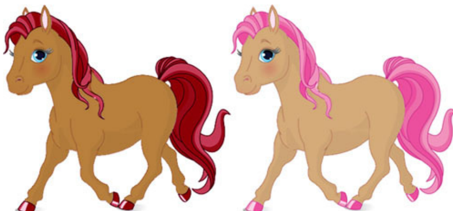
Seules deux juments avaient produit deux vainqueurs du Derby en cent ans : Perdita II et Morganette