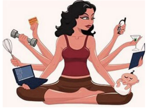
Ma mère nous encourage à multiplier tous nos talents

L'un de ces principaux talents que j'ai rejeté, c'est la cuisine. J'adore les pizzas, et je m'en suis régalé à la pizzeria de Harrods.