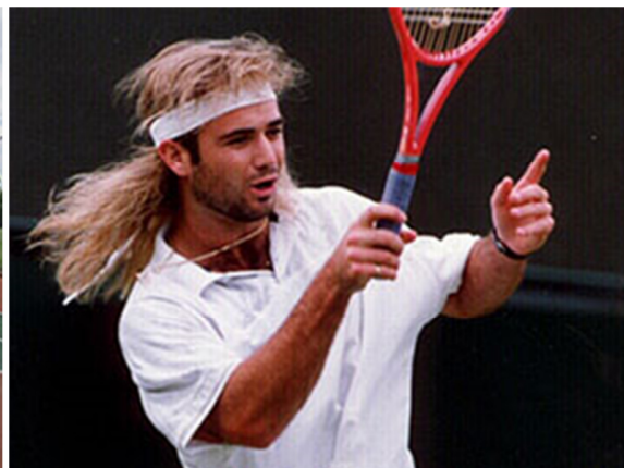
阿加西 (Andre Agassi)