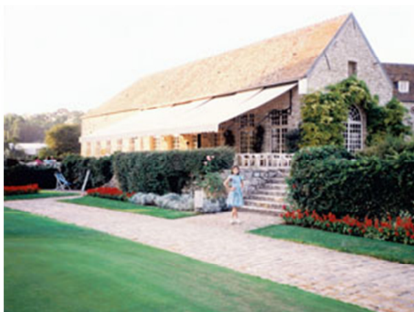
嘉心在 Saint-Nom-la-Breteche 会所留影