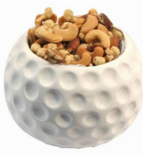
英国人叫球痴为果仁 母亲说是球痴夫人 们的苦果仁

当年定居巴黎时，我只有四岁。然而，两岁时，父亲的高尔夫球热情便已深深烙印在我身上。西班牙高尔夫巨星塞维·巴勒斯特罗（Seve Ballesteros）是父亲崇拜的英雄，为了一睹他的风采，父亲带着我去香港皇家高尔夫球会跟队观看球赛。当时父亲全部心神都在学习偶像打球上，居然完全忘记保护在烈日下曝晒的儿子。回家时，妈妈看到宝贝儿子晒得像烧红的龙虾，心疼不已。