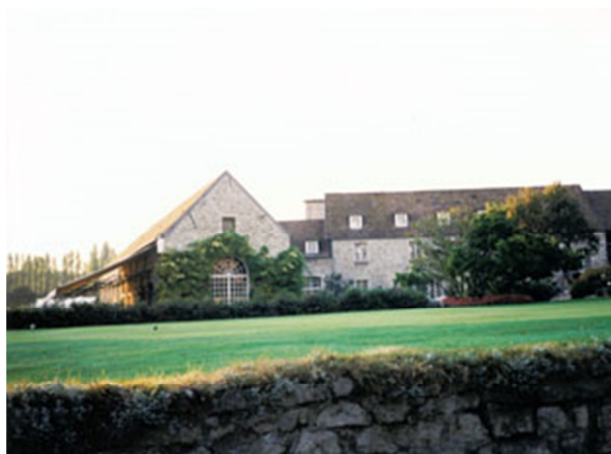
在 Saint-Nom-la-Breteche 球场度过周末

自此，每个周末我都在 Saint-Nom-la-Breteche 高尔夫球场度过。这里正是法国崇尚高尔夫球会举办法国公开赛的地方。父亲是球会内唯一的中国会员，也是唯一的亚洲会员。