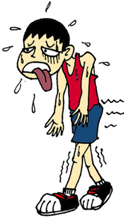
每天的耐力测试让我筋疲力尽