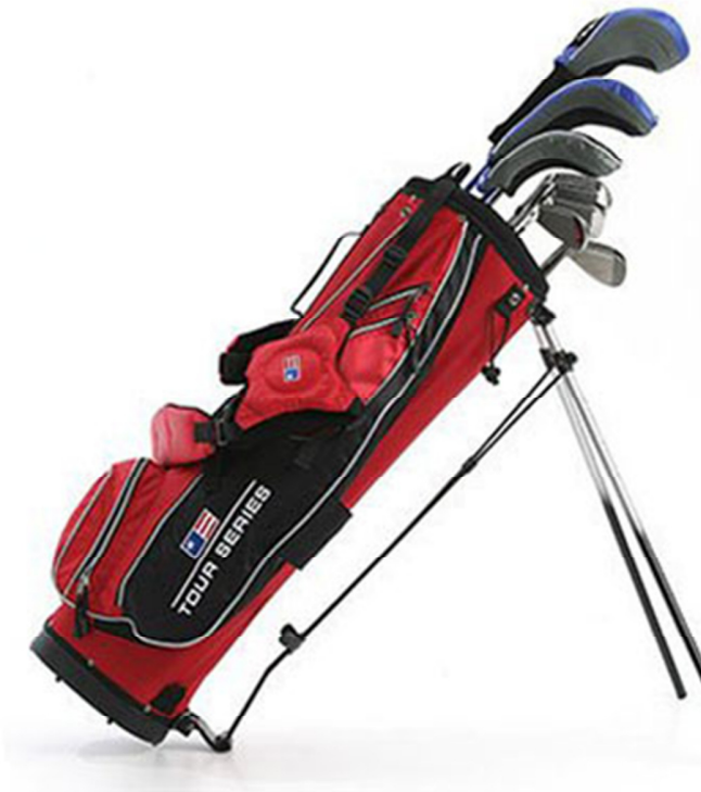
青少年高尔夫球杆超级套装