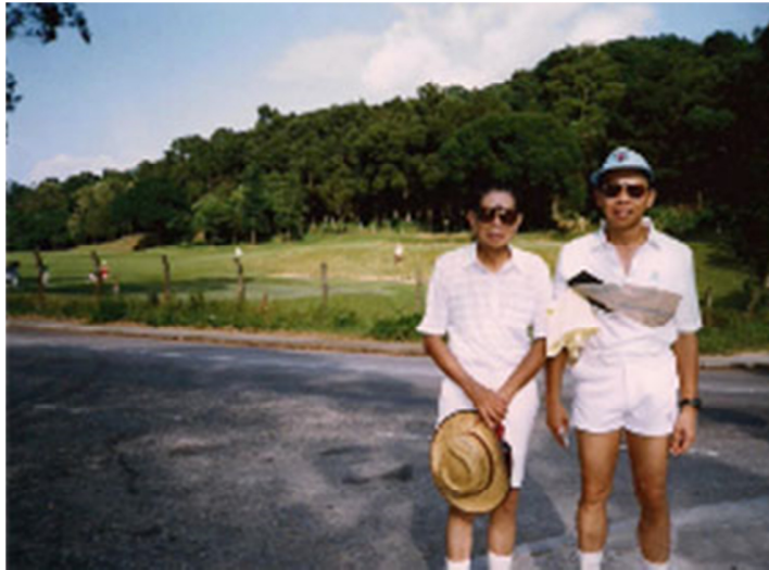
父亲与祖父走遍世界各地，享受高尔夫球之乐