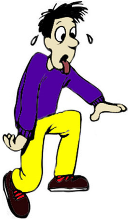
父亲在训练营陪我待了一个星期

父亲听我提到高尔夫球，像着了魔似的，立刻把我带到运动用品专卖店，给我挑选了一套精美的青少年高尔夫球杆。