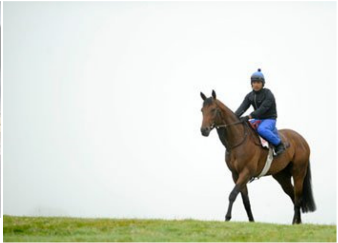
“海都市”离世而去，遗下“海都之星”为她撰写墓志铭

然而，马匹在赛场一决高下只不过是数分钟，瞬息即逝，赛马只是一个很短暂的过程。身为博彩媒体，他们都重视预测马匹输赢的赛果多于关注马匹本身的成就。当飞机渐渐接近香港时，我忽发奇想：““海都之星”的故事确实值得传诵，但由谁来负责呢？”正想入睡之际，半梦半醒的我脑海中浮现一句古老谚语：“求人不如求己”，我知道怎做了。