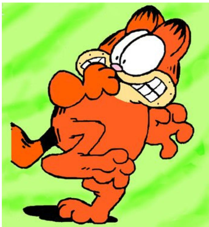
我紧张得四肢僵硬