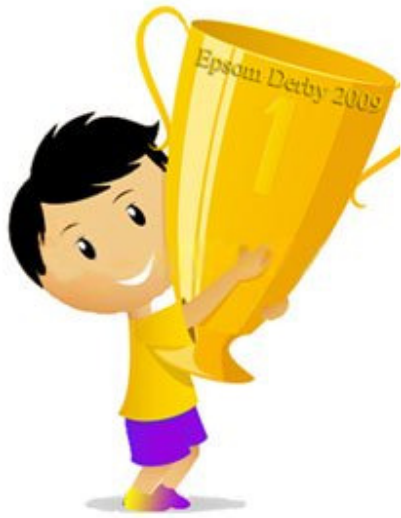
年仅二十七岁的年轻人赢得 2009 年的打吡大赛