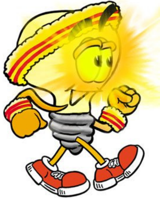
日文“Minoru”，意为“吾目之光”