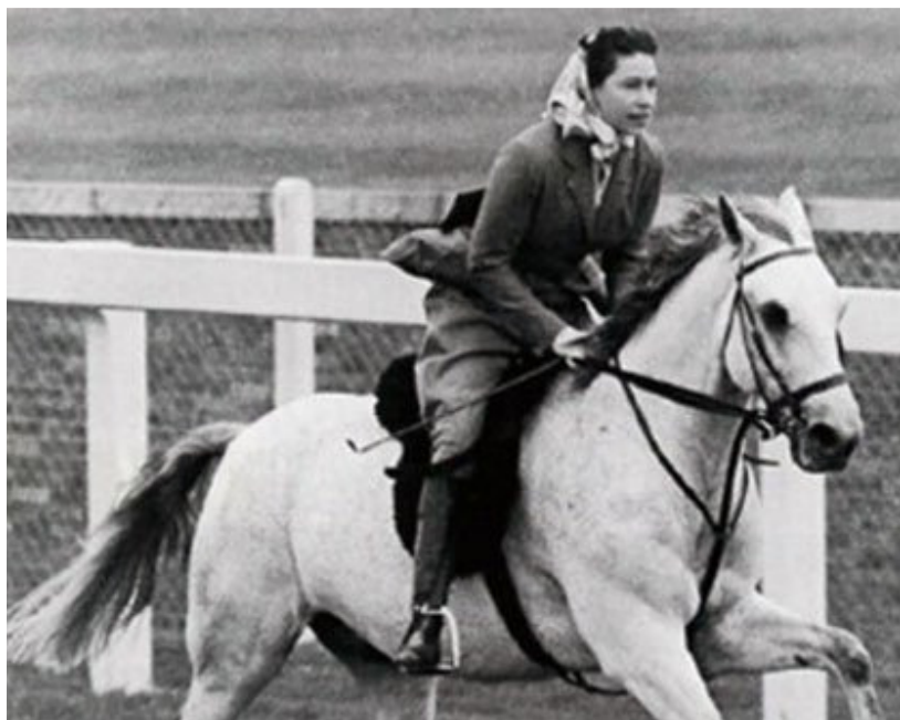
女皇拥有丰富的赛马和育马知识，热衷赛马

女皇接见了，我，祝贺我成为她记忆中最年轻的打吡大赛冠军马主，气氛轻松起来。女皇拥有丰富的赛马和育马知识，对“海都市”亦知之甚详，了解她在马场上和配种生涯中所创下的骄人纪录。最遗憾的是女王旗下马房的赛马从未能为女皇胜出过打吡大赛及凯旋门大赛。