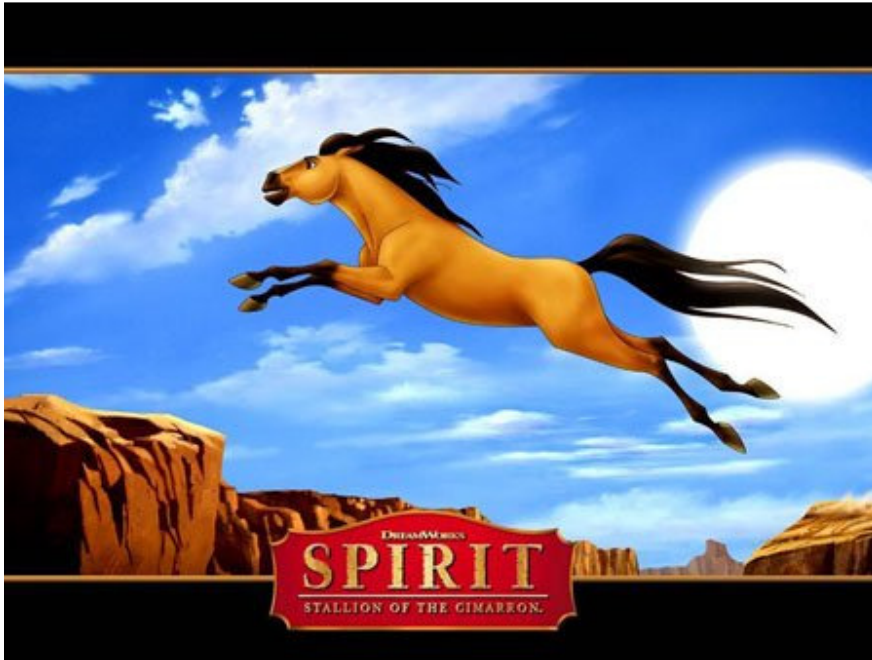
动画片《小马王》（Cimarron）的种马 Spirit 与母亲的名字相同

母亲从报章得悉一些博彩公司认为“海都之星”的体力仍有待证实，在赛程关键末段有可能被其它马匹超过。