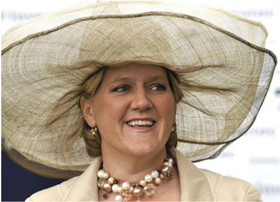
世界知名的电视赛马评述员 Clare Balding