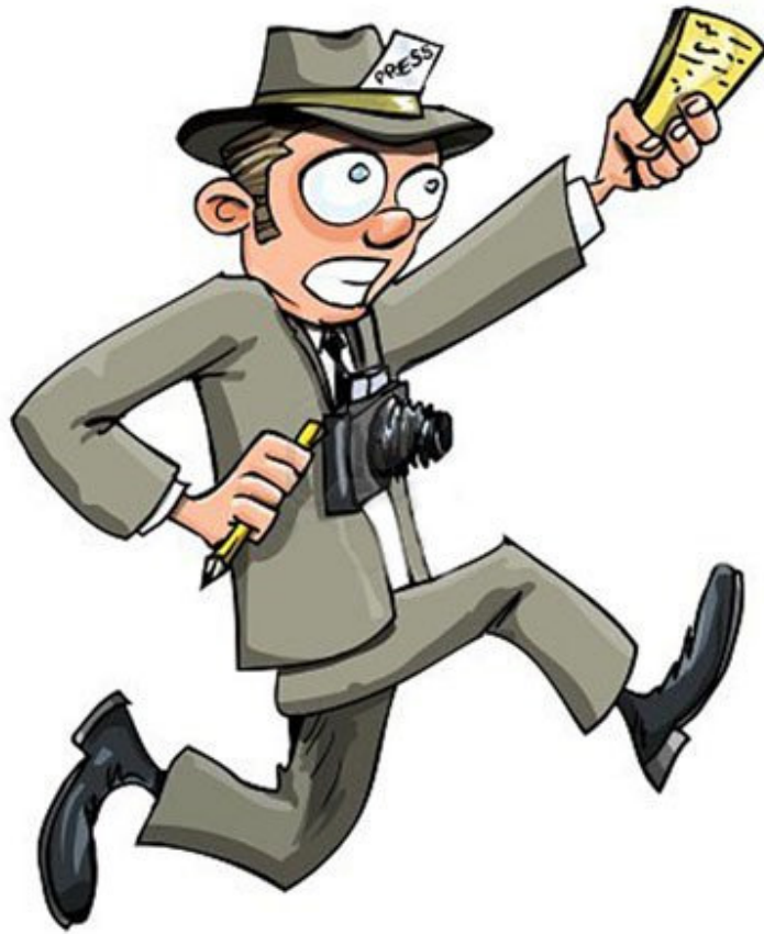
李思博先生现在是 Paris Turf 的赛马记者

他怎么能够错失亲眼见证“海都市”的儿子胜出打吡大赛冠军的机会呢？为了祝我好运，他把一张儿子克莱门骑着“海都市”的照片送给我，照片摄于 1992 年克莱门车祸前。我将照片一直保存在衣袋内，直到今天。