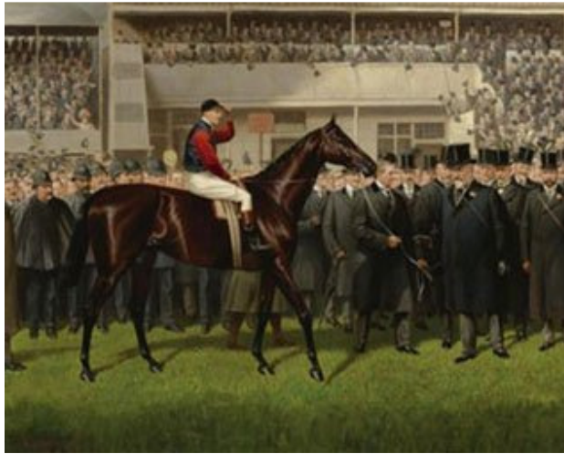
英皇爱德华七世名下的 Minoru