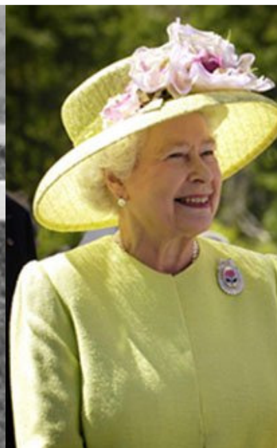
女皇温和亲切的形象，令我毕生难忘

女皇问我为何投身赛马事业，我解释说这一切都归功于母亲，是她在我童年时期，就把对赛马的热爱深深植根于我年幼的心间。见我年纪轻轻便已热爱马匹，又对马匹血统了如指掌，英女皇十分感动。