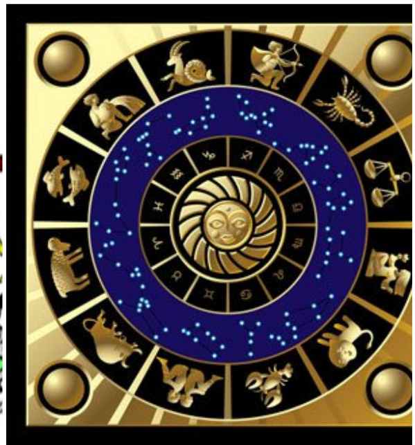
获加深信利用占星学能有效预卜马匹未来的潜力