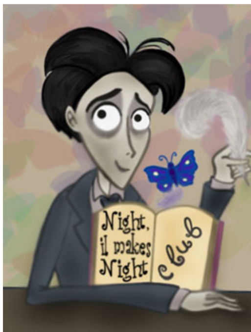
我不知道别人为何误会我是夜总会老板