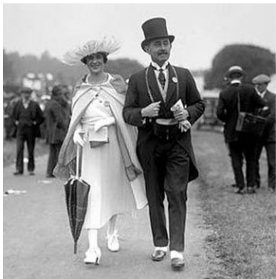
一百年前的英国皇家阿斯科特赛马会 (Royal Ascot)