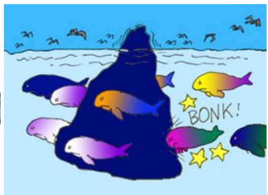
我的“灵”马会一路畅通无阻吗？