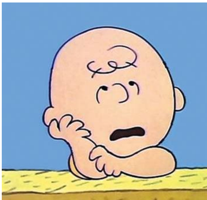
我的沉默寡言误导了大家

此刻我深切怀念着“海都市”，她虽然已然离世，但我觉得她此刻一定在另一个世界见证着儿子的骄人成就。正是这个深得崔家厚爱的家庭成员，让我的「灵」马之梦得以成真。