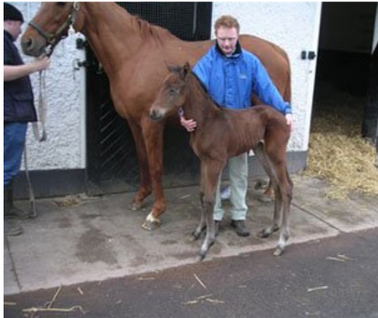
2006年4月6日，“海都市”和刚出生的“海都之星”