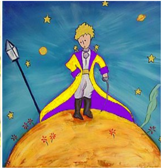
他就是我们宇宙的“小王子”