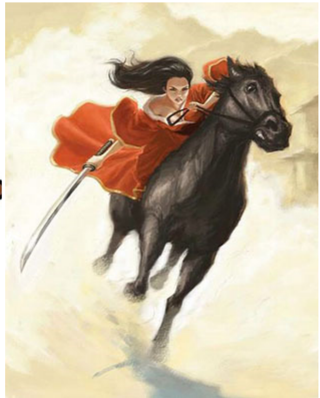
对了解母亲的我，在我眼中她与海都市是“女侠与爱驹”