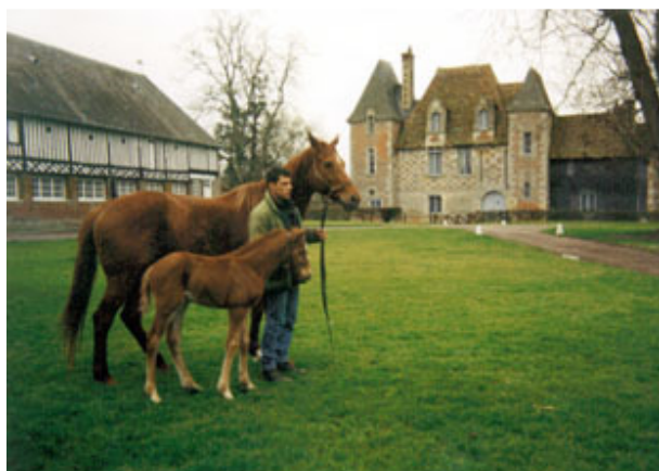
维多马场里只住着“海都市”与儿子“大海洋”