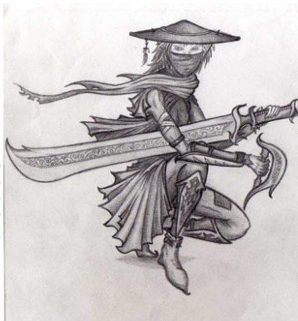
母亲永远积极进取，永不气馁。