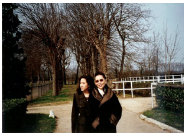
母亲与嘉心在多维尔的维多种马/育马场（Haras de Victot）共度周末

为了展开新的配种事业，母亲租用了他的老师兼好友韦士登刚刚空置出来的维多种马及育马场。这马场占地六十公顷，内设母马产房、公马配种棚，六十个马槽及备有员工宿舍及马主住堡垒，设备高档，租金昂贵，每月庞大的支出只为了培育一匹母马，是一件不可思议的事。但母亲一意孤行，于是海都市就成为了维多种马及育马场（Haras de Victot）的唯一住客。