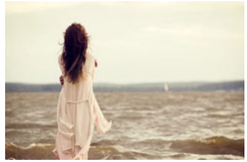
母亲失落时只能向大海倾诉

母亲成了育马界的笑柄，人家嘲笑她是“那个中国妇人与她的母马”（la Femme Chinoise avec sa Jument）。我想这些人未必是出于恶意，毕竟马匹配种及培育马匹是一项欧洲世代相传、规则严格的事业，育马业个中复杂，外行人不宜插手。