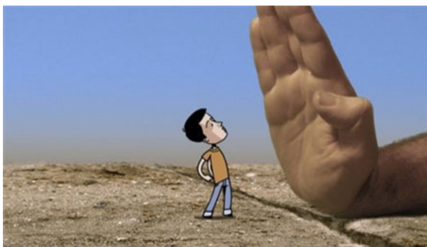
语言和文化横亘在民族与民族之间，成为沟通障凝