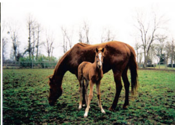
“海都市”与初生小雄马“大海洋”在维多马场