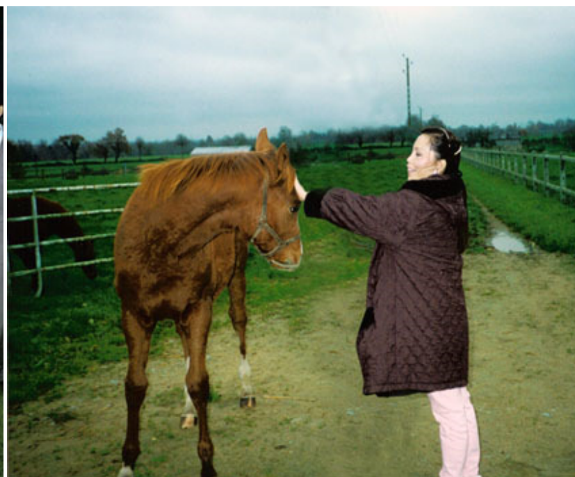
崔黄紫灵与“大海洋”

到了1996年的配种季节，母亲为她珍爱的“海都市”选择了穆罕默德酋长的爱驹“临泰莱”，他是1995年凯旋门大赛的冠军马。当时母亲配种专业知识并不丰富，只是遵循马界的一个说法行动，让最优秀的母马配最优秀的公马，培育出最优秀的下一代。