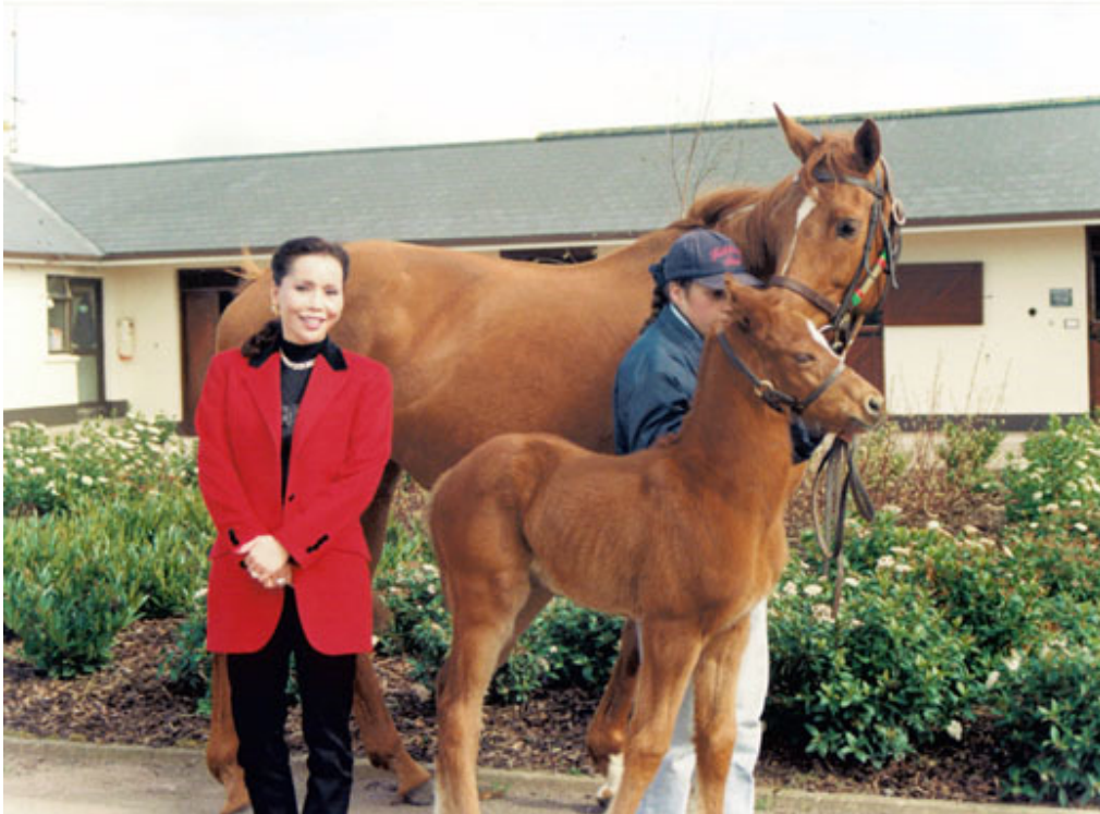
母亲与 1997 年“海都市”与“临泰莱”生下的小雌马“美利加”（Melikah）